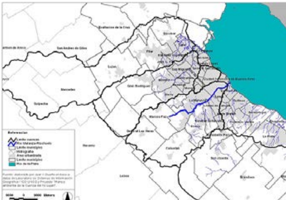
Mapa I: Las cuencas de la Región Metropolitana de Buenos Aires.