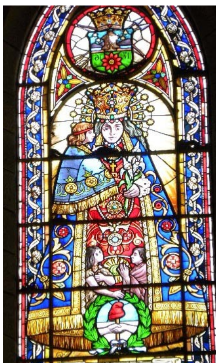
Fig. 6. Vitral de Nuestra Señora del Nahuel Huapi en la Catedral de Bariloche (Enrique A. Thomas, 1947).

La Virgen del Nahuel Huapi, de advocación toponímica, se entrelaza entre el relato de un catolicismo orgánico 95 y la representación de las raíces indígenas. Este discurso se transmite más claramente mediante las imágenes del vitral. Mientras el discurso sostiene una imagen mariana tradicional asociada al Bariloche del lago y su impronta nacional de la élite porteña y de inmigrantes europeos.