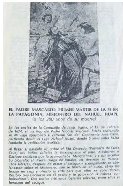
Fig. 2. Obituario del P. Mascardi. Parroquia de la Inmaculada Concepción, Bariloche 1994.

Pero es el P. Mascardi el que reúne las condiciones de la muerte martirial 54 o sea “el testimonio que llega al esparcimiento de la sangre por la propia fe en Dios y en Cristo” 55 , ya que no todo testimonio por la fe conlleva la entrega de la vida y la muerte sin poner resistencia alguna. Las crónicas resaltan elementos que completan esta afirmación, tales como: a) la escritura casi inmediata de su biografía 56 con la “intención de servir de inspiración para los jóvenes misioneros” 57 ; b) su preparación y templanza física y espiritual para recibir el martirio ante la adversidad, donde la “geografía aunque muy difícil de ser enfrentada es siempre apenas un obstáculo que mas que significar un impedimento significa una forma de testimoniar la fe y resaltar las cualidades del misionero” 58 ; c) la lucha contra el demonio, tanto en el marco de la resistencia a la tentación, como en la lucha contra el mal que se consuma en la muerte martirial 59 : “Mas después instigados del demonio por la guerra, que le hacia el padre, le quitaron la vida” 60 ; d) la evocación de santos misioneros que los precedieron como modelo, que en el caso de los jesuitas del Nahuel Huapi, fue San Francisco Javier 61 ; la predestinación divina acompañada de la libre aceptación del hombre