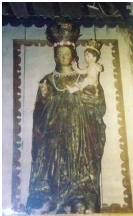
Fig. 8. Nuestra Señora de Loreto en Santa María de Achao, Chiloé, Chile. Foto situada en el Panel del Atrio de la Catedral de Bariloche que ilustra el hallazgo de la Virgen de la Misión del Nahuel Huapi.