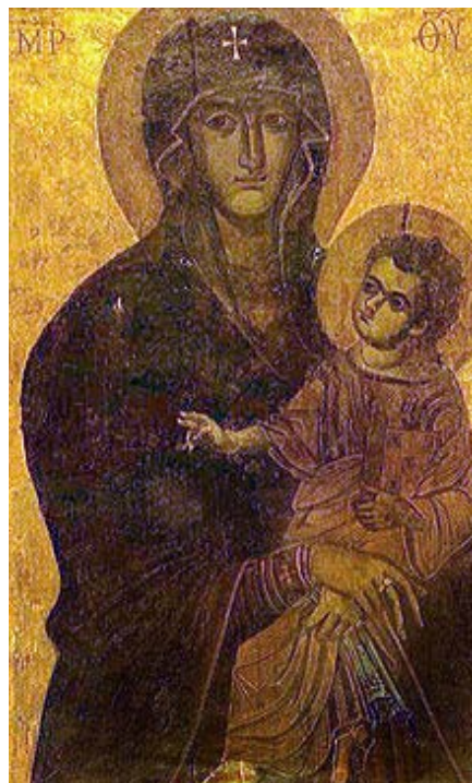
Fig. 5. Nuestra Señora del Populo (San-ta María la Mayor, Roma). Icono bizantino que representa a la Madre y el Niño.