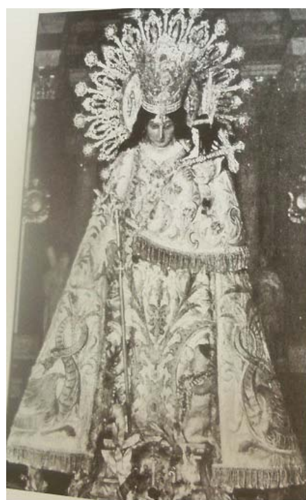
Fig. 7. Nuestra Señora de los Desamparados. Fuente: Schenone, Héctor (2008), Santa María. Iconografía del Arte colonial . Buenos Aires EDUCA: 370.