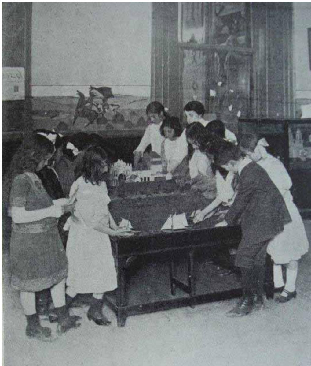
Imagen 3 - Un maestra adscripta al Museo Escolar Sarmiento explicando a los alumnos una maqueta de Buenos Aires en el pasado (Biedma, 1953).

Etnográfica Americana, donde los objetos se exhibieron colocados en reconstrucciones de ambientes, con la idea de representar la labor indígena así como las condiciones étnicas y geográficas. Cabe señalar, que en los planteos de educación nacionalista como los de Ricardo Rojas, las piezas y sitios indígenas eran vistos como parte integrante del “territorio y de la emoción misma del paisaje” (ROJAS, 1909, p. 458).