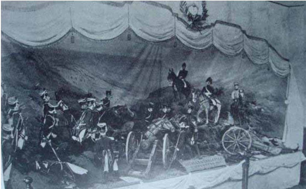
Imagen 2- Escena con figuras de cera, representando la Batalla de Chacabuco. Museo Escolar Sarmiento (Biedma, 1952).

idea que une la historia de un museo con la biografía de su organizador. Pero esta unión revela otro aspecto: la fragilidad de las instituciones argentinas y su carácter de refugio o “corporización” de las buenas intenciones, lecturas e intereses de sus promotores (PODGORNY, 2009).