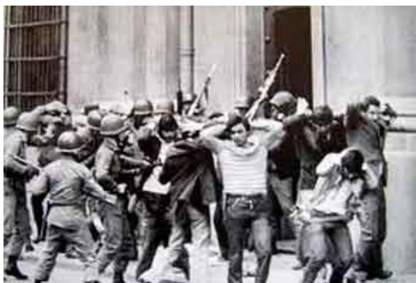
Foto 4 - Em 16 de setembro de 1976, efetivos de segurança do Estado começaram um operativo, que durou vários dias, para efetuar detenções massivas de estudantes de secundária na cidade Argentina de La Plata.