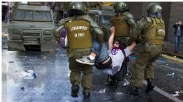
Foto 3 - Grupos de encapuzados se enfrentaram com a polícia, ao finalizar uma massiva mobilização estudantil que exigia educação superior gratuita e de qualidade.