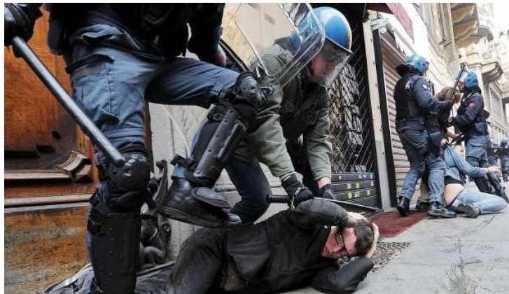
Foto 2 – Se enfrentam estudantes e policiais na Itália por cortes na educação.