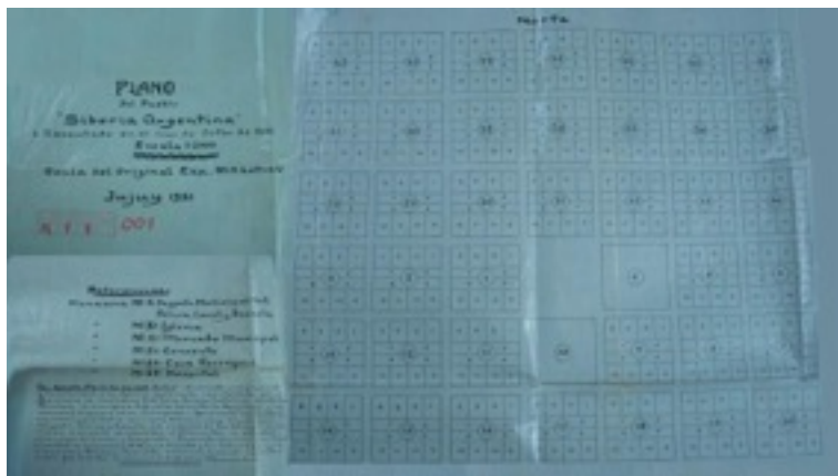
Figura 6. Plano de Abra Pampa de 1931. Copia del original de 1883.

La arqueología ha demostrado que en el propio sitio de la ciudad actual se encontraron entre 1904 y 1907 ruinas prehispánicas muy deterioradas que pertenecieron al Período de Desarrollos Regionales entre el 800 y 1470 D.C. (JUJUY. Diccionario General, 1993. Tomo I: 42). En 1892 ya existía una estafeta postal conocida con el nombre de "Siberia Argentina" aunque se ignora la fecha en que se inició el servicio telegráfico. El 14 de agosto de 1883, la legislatura de la provincia sancionó una ley mediante la cual se fijaba la necesidad de fundar un pueblo en el