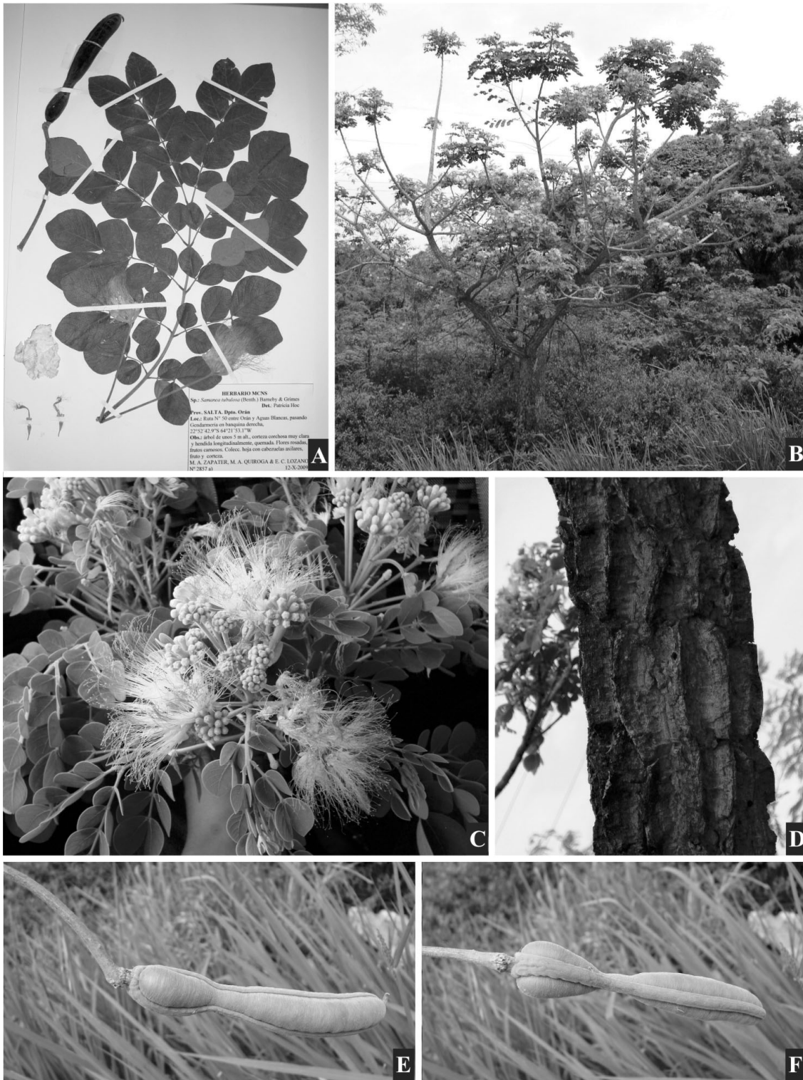
Fig. 2. Samanea tubulosa . A , ejemplar de herbario. B , planta en floración. C , rama hornótina florífera. D , detalle de la corteza. E , F , fruto. De Zapater et al. 2857 (MCNS).