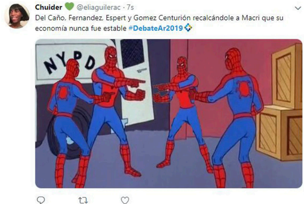
Imagen 14.

candidato contrincante del debate) es también uno de los motivos temáticos recurrentes e históricos de la prensa en sus relatos sobre los debates televisados.