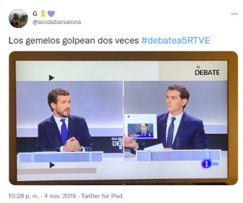
Imagen 13.