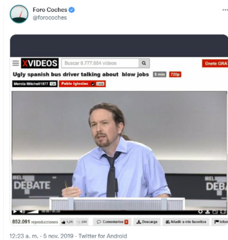
Imagen 7.

lo cual no deja de ser significativo. Es el caso de un tuit con 27 400 likes y 8 175 retuits escrito por la pornostar Apolonia Lapiedra y otro de 15 800 likes y 5 912 retuits que hace alusión a la web de vídeos pornográficos XVideo (imagen 7). Esto es debido a que uno de los temas que, como veremos, más se reproduce en los memes analizados es el lapsus de Pablo Iglesias que en un momento del debate pronunció la frase “dar la razón a las mujeres que están escandalizadas con lo que hemos visto en Manresa, con lo que hemos visto en tantas mamadas, en tantas manadas” 7 . La confusión momentánea con este sinónimo vulgar de la palabra felación provocó que buena parte de los memes contengan motivos temáticos vinculados a la sexualidad. De hecho, el tuit de Apolonia Lapiedra, el tercero más compartido del corpus, simplemente consiste en una frase de ella comentando: “Si iban a sacar este tipo de temas deberían haberme invitado al #DebateElectoral”.