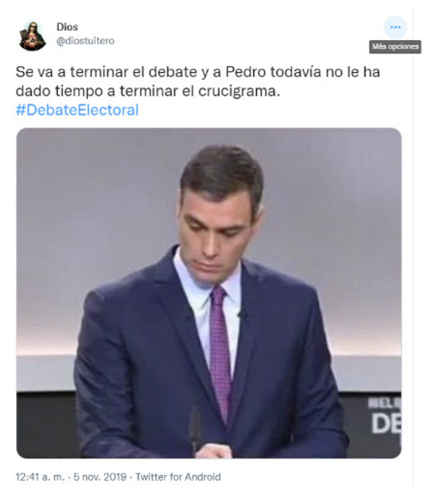
Imagen 11.