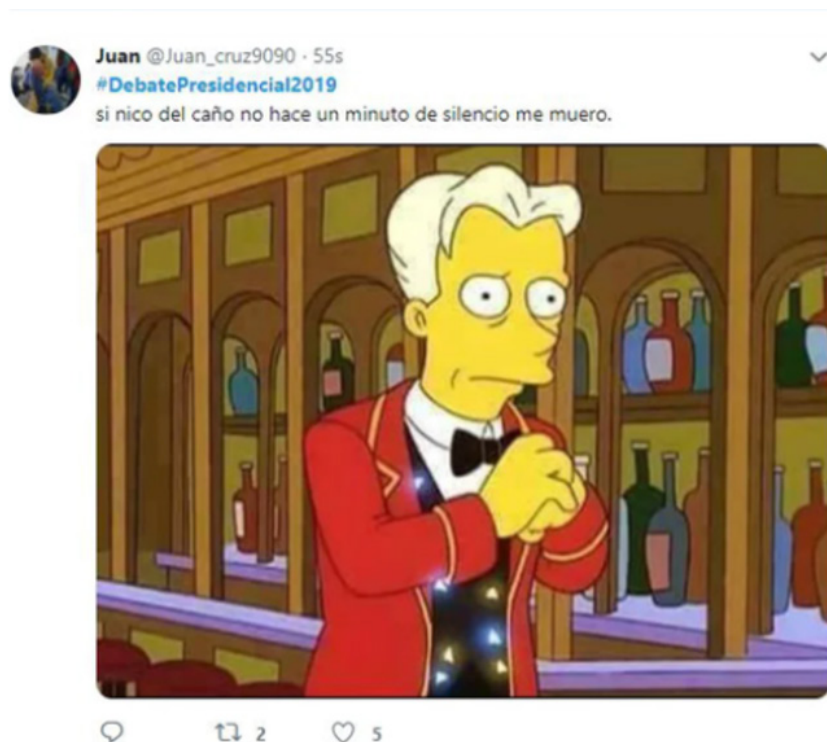
Imagen 9.

La construcción del significado humorístico alrededor del debate que conforman estos memes la podemos observar con mayor detenimiento si analizamos los personajes y los temas del corpus. La mayoría de los memes vinculados al debate presidencial argentino que son retomados por los diarios digitales están protagonizados por Nicolás Del Caño, el candidato del Frente de Izquierda (9 tuits). Hacen alusión temáticamente a la escasa presencia histórica de su partido en el campo político y/o mediático. También se enfocan en un fragmento del debate en el cual él pidió un minuto de silencio por los campesinos muertos en Ecuador: “producto de la represión del FMI”. Esta pausa sorpresiva en mitad de la transmisión fue mediatizada y viralizada en las redes sociales y los memes se hicieron eco de ella retomando, como es usual, algún fragmento de Los Simpsons (Imagen 9).