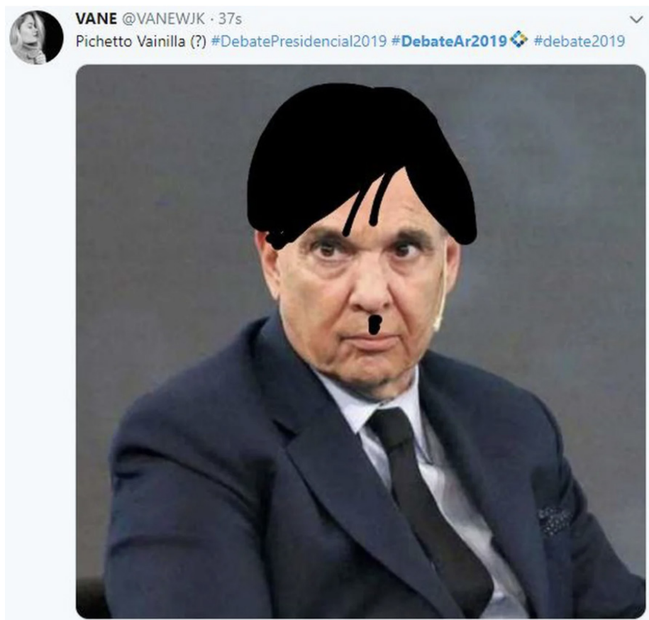
Imagen 10.

Incluso uno de los memes, recogido por Infobae (imagen 10), no menciona explícitamente al generador de la comparación (el candidato Del Caño), y por el contrario construye lo risible a través de una operación de condensación en la fotografía editada con los rasgos del líder nazi —el pelo y el bigote—, y los del candidato Pichetto —el resto de la cara y cuerpo—.