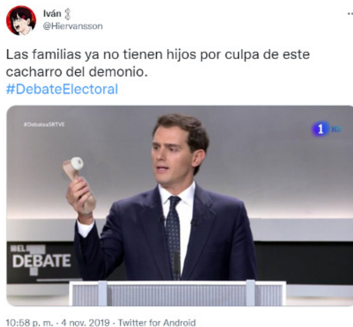
Imagen 6.

En el caso español, los tuits analizados alcanzan cifras de circulación realmente destacables. La tendencia habitual es que los medios seleccionen tuits que, bien por el uso del hashtag o bien por partir de cuentas con muchos seguidores, lleguen a varios cientos, a veces miles de likes y de retuits. Así, el meme que más difusión consiguió obtuvo 51 700 likes y 23 193 retuits. El tuit más compartido (imagen 6) lo reprodujo La Vanguardia y consistía en un fotomontaje en el que se adjudica a Albert Rivera una frase de carácter conservador sobre un objeto muy de moda en los memes del momento en España, el juguete erótico para mujeres conocido como satisfyer , combinado con un texto verbal que simula ser una frase pronunciada por Rivera.