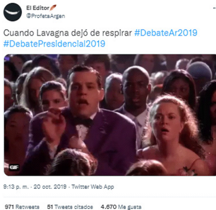
Imagen 4.

Antes era la prensa quien figuraba a los políticos hombres como “lentos” y los descalificaba por su supuesta falta de “capacidad de reacción”. Esta operación se hacía a través de articulaciones de materias significantes (dibujos o fotografías de una tortuga), así como de referencias verbales y combinaciones de ellas. En este caso son los internautas los que la generan en sus memes también articulando imágenes con texto lingüístico: