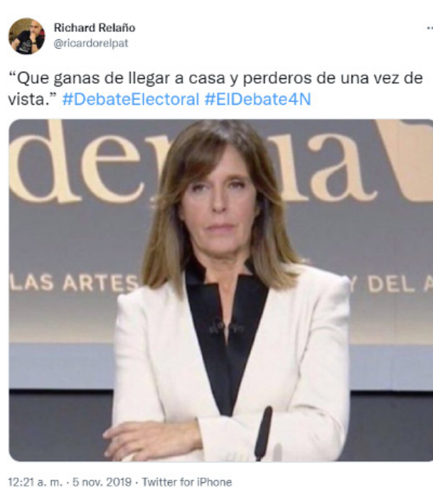
Imagen 12.

En suma, podemos concluir que lo que más abunda son los motivos temáticos vinculados al metahumor con el propio debate, con cuestiones que sucedieron en el desarrollo del mismo. Así ocurre también con los memes que protagoniza Pablo Casado, mayoritariamente alusivos a una frase que dijo en su alocución final: “Me gustaría estar en tu casa ahora para mirarte a los ojos” y que los tuiteros interpretaron como una expresión que asustaba a los espectadores, más propia de película de terror. Solo uno de los memes profundiza algo más en cuestiones ajenas al propio debate y más cercanas a aspectos de cultura política, como en el meme en que utilizan sendas capturas de Casado y Rivera en el debate junto a un título de película, Los gemelos golpean dos veces , para dar a entender que no hay diferencias (en el aspecto, quizá también en lo político) entre los candidatos de PP y Ciudadanos (imagen 13).