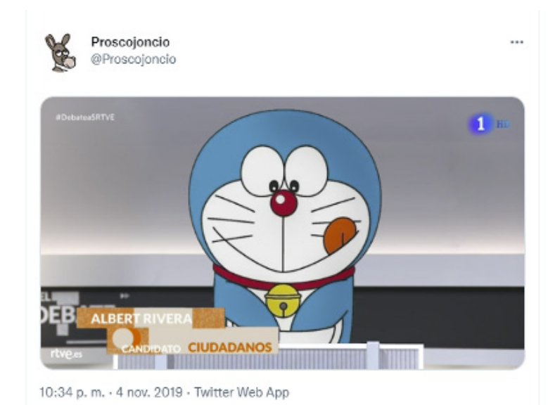
Imagen 8.

También entre los memes con más difusión se encuentran los que hacen referencia a la estrategia de Albert Rivera de sacar objetos del atril de debate para ejemplificar en sus intervenciones o hacerlas más llamativas y memorables. De tal modo, hay varios tuits distintos que, en esencia, aluden al mismo concepto humorístico: comparar al entonces líder de Ciudadanos con el gato Doraemon, protagonista de la serie infantil de anime del mismo título, que se caracteriza por sacar inventos de su bolsillo mágico. Hemos encontrado en la muestra tres que basan su comicidad en esta analogía pero sin duda el más exitoso fue el fotomontaje de la cuenta de humor @proskojoncio (que tiene más de 109 000 seguidores) y que cosechó 16.000 likes y 7264 retuits (imagen 8).