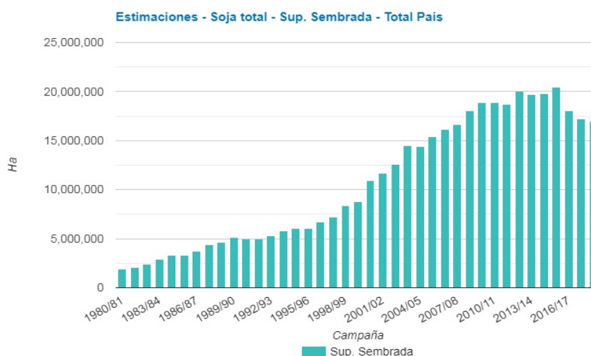
GRÁFICO 2: PRODUCCIÓN DE SOJA EN LA REPÚBLICA ARGENTINA, 1980-2017 (FUENTE: ELABORACIÓN PROPIA EN BASE A DATOS DEL MINISTERIO DE AGRICULTURA, GANADERÍA, PESCA Y ALIMENTACIÓN, 2019).