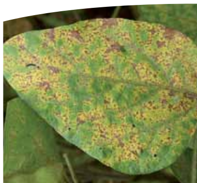
Roya en foliolo de soja.

campañas 2013/2014 y 2014/2015 presentaron los mayores valores de incidencia (70% y 80%, respectivamente) y severidad (15% y 30%, respectivamente). En ambos ciclos agrícolas los porcentajes de precipitación del período abril-mayo estuvieron un 30% por encima del promedio histórico. (Tabla 2).