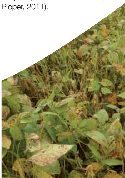
Lote con EFC.

pachyrhizi ). Esta última se convirtió, desde su primera detección en el ciclo 2003/2004 en un factor de preocupación para los productores de las diferentes zonas agrícolas del país (González et al. , 2006; Ploper, 2011).