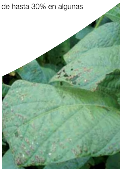
Tizón de la hoja por Cercospora .

manifiestan con mayor intensidad en los estados reproductivos intermedios a avanzados (desde R3 a R6). Estas llegan a causar pérdidas anuales de rendimiento promedio del 8%, habiéndose citado mermas de hasta 30% en algunas