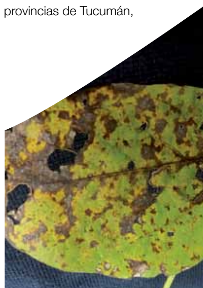
Foliolo con EFC.

reproductivos del cultivo y se determinó la incidencia y la severidad de las principales enfermedades. Estos monitoreos se realizaron en lotes comerciales de soja ubicados en diferentes localidades de las provincias de Tucumán,