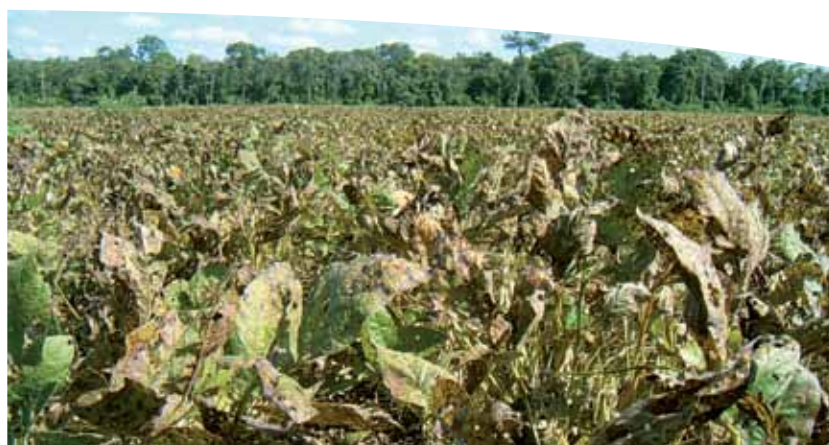
Lote comercial afectado con tizón de la hoja por Cercospora .

En la Tabla 2, se presentan los valores de incidencia y severidad de mancha anillada en los ciclos 2004/2005 a 2014/2015. Las