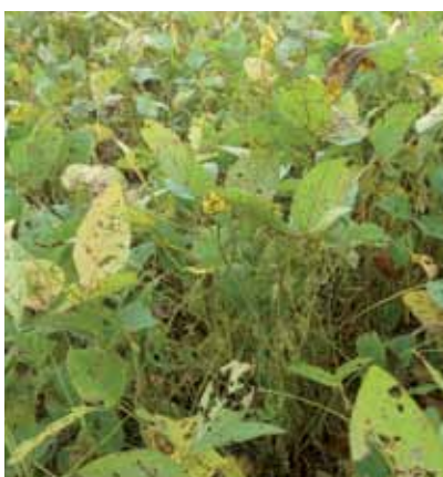
Lote afectado con EFC (Tizón de la hoja y roya)

En el presente trabajo se presentan los resultados de las prospecciones de enfermedades en el cultivo de la soja realizadas durante las campañas 2004/2005 a 2014/2015 en la provincia de Tucumán y zonas del NOA.