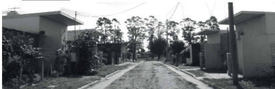
Título: Barrio Coronel Dorrego, Santa Fe. Fuente: elaboración propia según trabajo de campo realizado entre los años 2015-2017, Barrio Coronel Dorrego, Santa Fe.