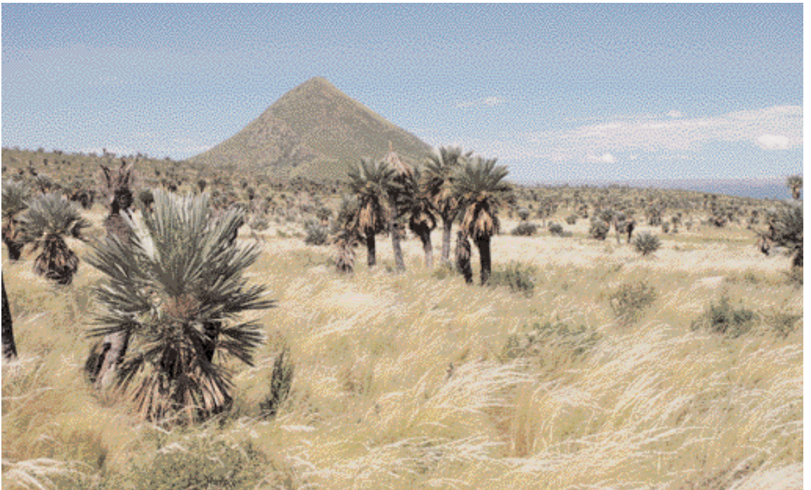
Fig. 4. Palmares de Trithrinax campestris en la Pampa de Pocho, entre las localidades de Taninga y Las Palmas, sector 6 de la excursión. En el primer plano se observan individuos de palma y al fondo la silueta del volcán Ciénaga o Boroa.