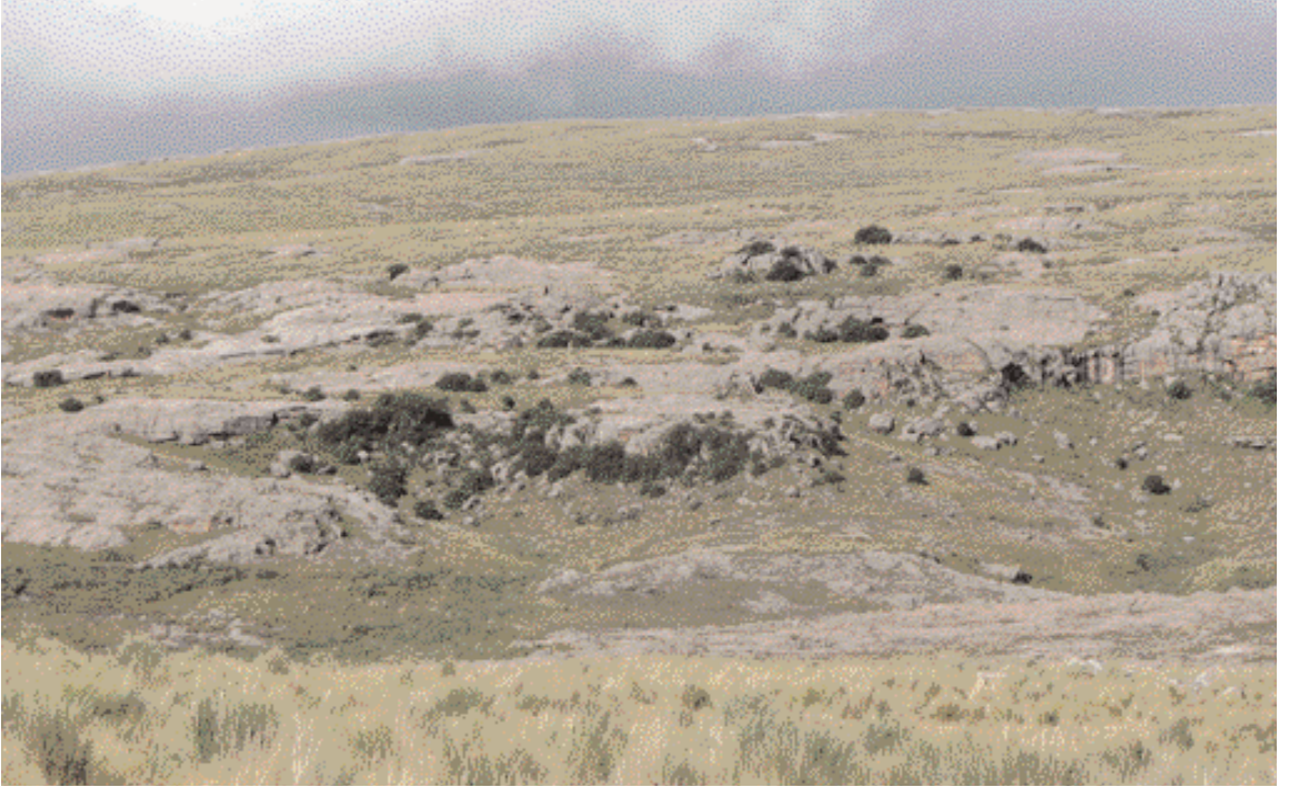
Fig. 3. Pastizales y Bosques de altura en Ea. La Trinidad, Parque Nacional Quebrada del Condorito. El paisaje corresponde a los sectores 3 y 4 del recorrido.