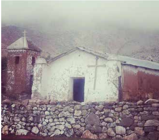
Figura 4. Imagen de la fachada y la torre campanario de la iglesia de Campo de la Paz.