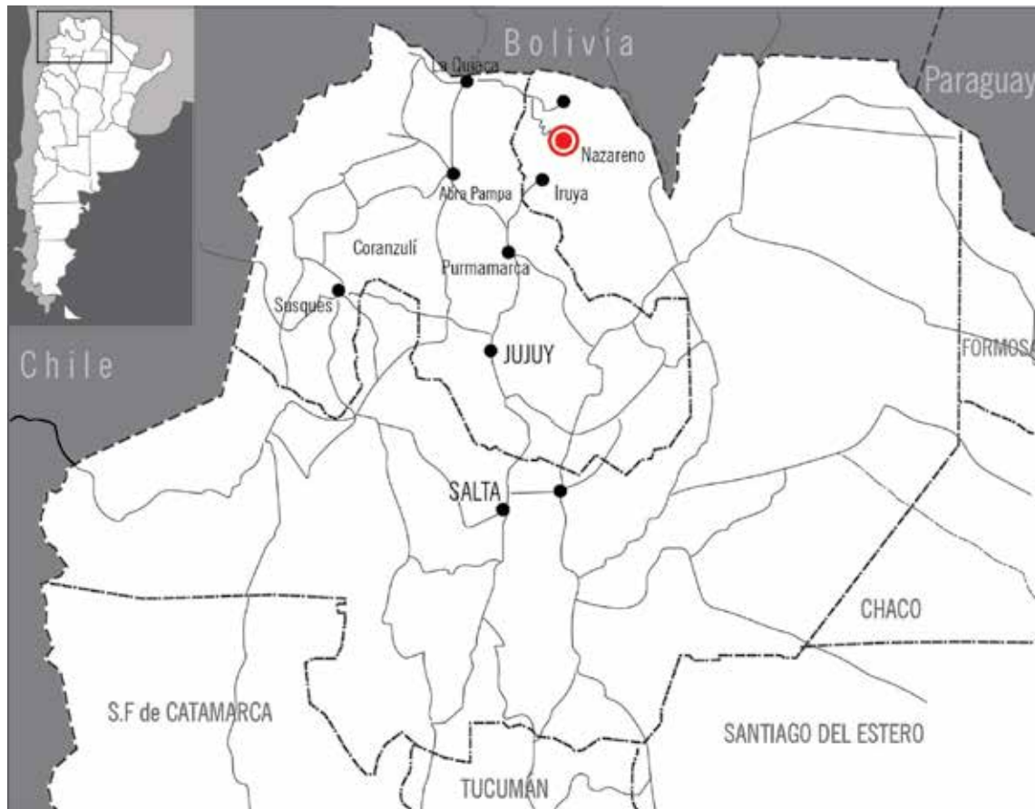
Figura 1. Mapa de ubicación del área de estudio: región del NOA argentino. Elaboración de la autora.

En términos ambientales, el régimen climático corresponde al semiárido de alta montaña, con una temperatura media anual de unos 14 ° C. Las amplitudes térmicas diarias pueden llegar hasta los 20° C (Bianchi y Yañez, 1981). Existe una importante variación micro climática en relación con la topografía, con una mayor concentración de humedad en las quebradas y en el fondo de valle. La variedad de su flora es un rasgo característico de la región. El sector occidental revela el predominio de la Puna, con tolas y yaretas, y a medida que la temperatura aumenta y decrece la altitud, las especies tropicales aparecen en abundancia, ya que se dan las condiciones para la formación de bosques y selvas montanas con