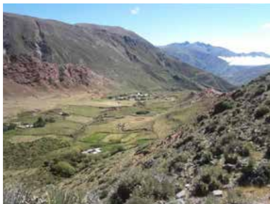
Figura 3. Poblado de Campo la Paz, año 2019.

El conjunto parroquial se compone de dos volúmenes principales (la nave central y una torre campanario ubicadas al costado este de la nave), ambos se encuentran a una distancia entre sí. El conjunto se complementa con una pequeña habitación, a modo de sacristía, que se adosa a la nave única en la parte posterior, un depósito o lugar de guardado, ubicado en el perímetro norte del terreno, y un sanitario al fondo del predio. Todo esto se delimita por un muro de pirca 7 que llega al metro veinte de altura, dejando un patio al frente de la fachada, que actúa de atrio de la iglesia y desborda a la plaza seca (Figuras 4 y 5).