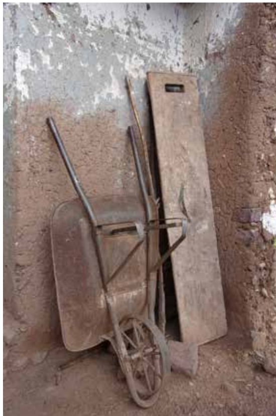
Figura 11. En la fotografía se observan algunas de las herramientas, como la carretilla y un lateral de la tapialera. La perforación que tiene el lateral de la tapialera es donde la tapa se incrusta para ser amarrada por la coyonda.

Los muros tienen un espesor de 0,45 m y una altura de 3,40 m en la parte más alta, y 3 m en la zona baja. Estos muros no tienen cimiento ni sobrecimiento, pero sí se observan algunas piedras aisladas de tamaño considerable en la primera hilada del tapial. Aun así, los muros mantienen un buen estado de conservación sin presentar más daños que el desgaste por el paso del tiempo.