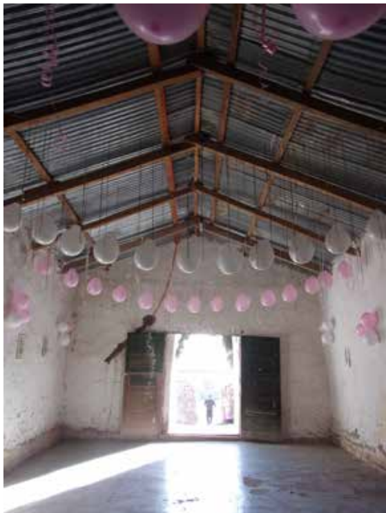
Figura 6. Interior de la nave con vista hacia la puerta principal. Se observa la estructura de madera de la cubierta y la ornamentación del día de la fiesta.