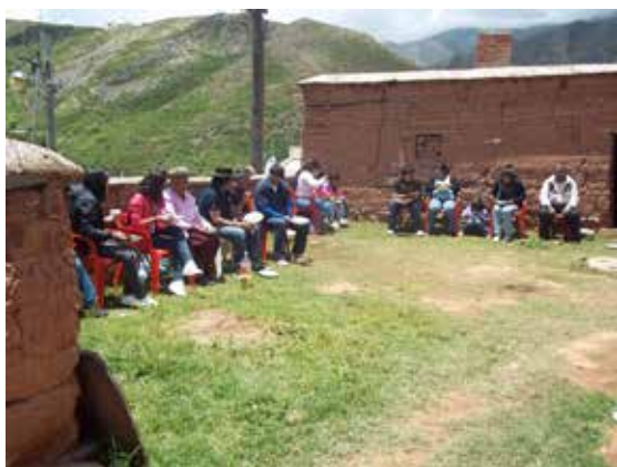
Figura 12: En el patio de la casa de los Cruces, en el momento antes del almuerzo comunitario. Año 2013.

Se diría entonces que la territorialidad asociada con el oratorio está dada en dos aspectos: por un lado en la materialidad del mismo, el que se produce en una dinámica semejante al de la iglesia y con la creación de relaciones entre los diferentes pisos ambientales propios de la zona para la obtención de recursos; por el otro lado, en el aspecto social, en torno a las relaciones cercanas a la familia celebrantes o por la adhesión que tenga el santito que se festeja, reforzando vínculos y territorialidades (Figura 12).