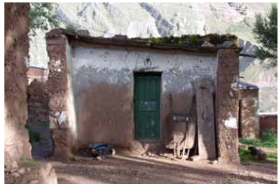
Figura 9. Fachada del oratorio de la familia Ibarra en año 2017.

La casa de los Ibarra está enteramente realizada con la técnica de tapial, tanto los diferentes recintos, entre ellos el oratorio, como el cerco perimetral. En la investigación que venimos realizando esto no es recurrente, debido a que en la actualidad solo se registró el empleo de tapial para la realización de cerramientos de patios, delimitaciones de sembradíos y corrales para animales, es decir construcciones bajas. Otro ejemplo en donde se ha podido observar esta técnica es en la Iglesia del propio pueblo de Nazareno, donde el tapial es de forma trapezoidal, y los muros son de bases anchas que disminuyen a medida que aumentan en altura (Veliz, 2018).