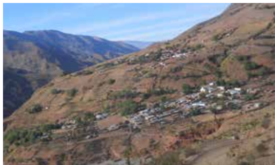
Figura 8. Poblado de Poscaya, año 2017.

El lugar donde se localiza es una ladera de montaña, su organización responde a esta topografía, estructurándose con caminos serpenteantes y casas que se adhieren a la montaña a través del aterramiento del terreno. Se diferencian dos zonas, Campo Rodeo, en la parte elevada, y Poscaya propiamente dicho, en la zona baja. En Campo Rodeo las casas se encuentran dispersas y la mayoría incorpora al domicilio áreas de sembrado y corrales. El barrio de abajo, en cambio, se estructura a partir de una calle central donde las casas se ubican una a la par de la otra, dejando el área de sembrado a las orillas del conglomerado. En el inicio de esta calle principal se ubica la iglesia, y al final del recorrido la cancha de fútbol. El oratorio analizado se ubica en el sector de arriba (Figura 8).