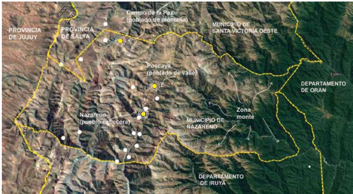
Figura 2. Mapa del Municipio de Nazareno y localización de poblados, año 2020. Elaboración de la autora.

zonas libres de heladas, que colindan con el Parque Nacional Baritú (Piccardo, 2005).