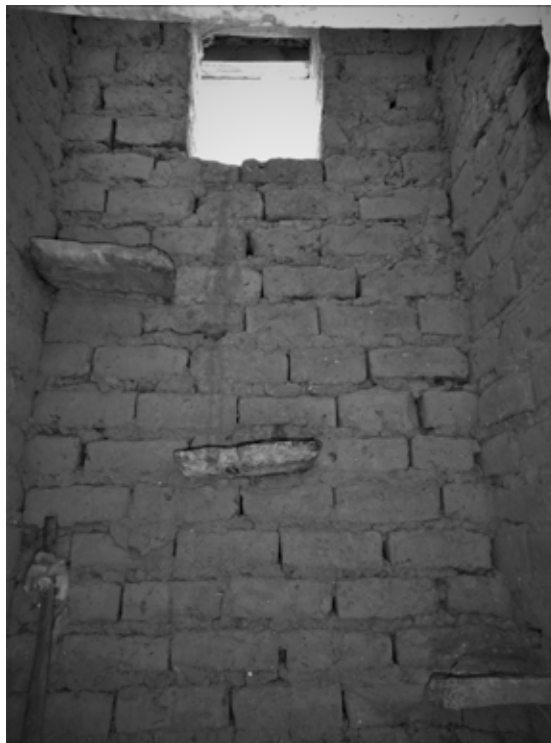
Figura 7. Muro interior de torre campanario. Se observan las piedras empotradas, por donde se asciende para realizar el repique.

El otro volumen, la torre campanario, se asienta sobre un sobrecimiento de mayor dimensión que la base de la torre, tal que este borde que sobresale es empleado como asiento para las actividades que se llevan a cabo en el atrio de la iglesia. Las paredes de la torre campanario conforman una planta de forma cuadrada, alcanzando los 5,50 m de altura, esta misma se encuentra separada a un metro de distancia de la nave única. En el remate se observa un cuerpo piramidal, realizado con hormigón armado, desde donde cuelga un elemento de metal utilizado como campana, y como remate en la parte superior se ancla una cruz de metal.