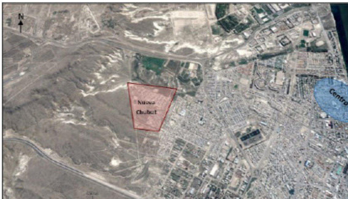
Figura 1. Localización del Barrio Nueva Chubut, Puerto Madryn.