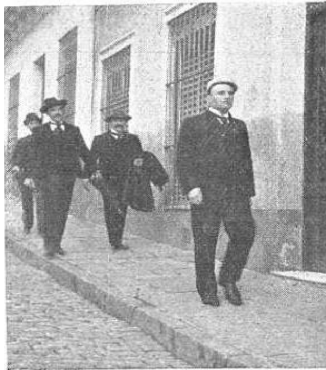
EL ANARQUISTA RISTORI PASEANDO POR LAS CALLES DE MONTEVIDEO

Imagen 4. "La fuga del anarquista Ristori", Caras y Caretas , Buenos Aires, No. 250, 18 jul. 1903.