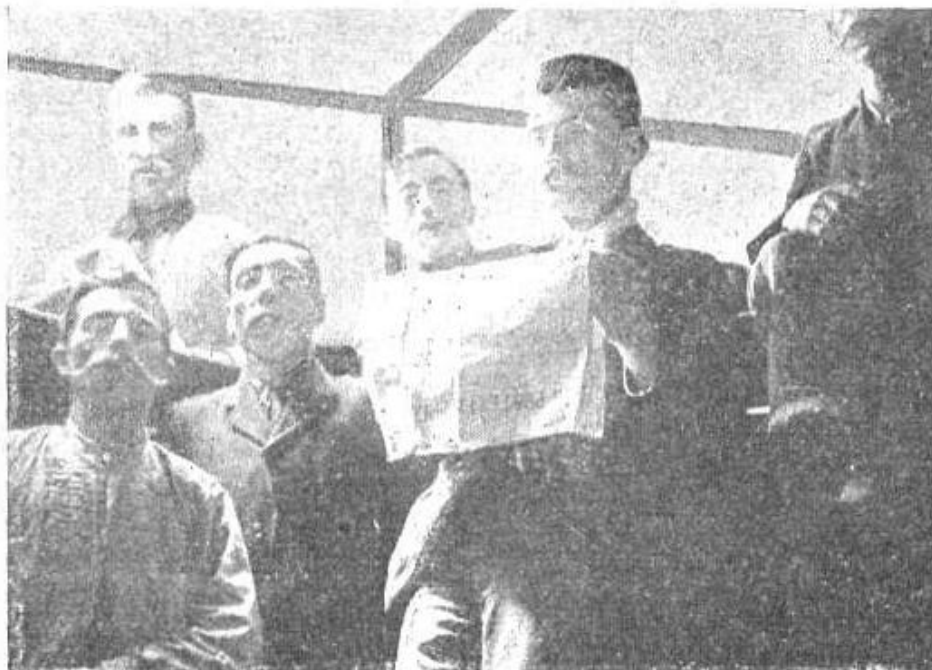
LOS ANARQUISTAS DEPORTADOS EN LA BODEGA DEL «REINA MARÍA CRISTINA»