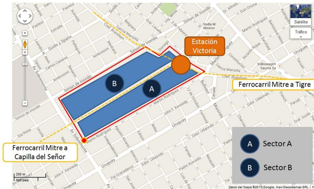
Figura N°1: - División en sectores de predio ferroviario de la estación Victoria.

El único sector del predio actualmente destinado a usos residenciales es el cercano a la estación y que se extiende por la calle Martín Rodríguez hasta su intersección con Edison (al sur del sector A, Figura N°1). Las viviendas sobre la calle Martín Rodríguez no evidencian déficits estructurales pudiendo categorizárselas como construcciones antiguas, probablemente edificadas y habitadas por empleados del ferrocarril durante la primera mitad del siglo XX. Resultó relativamente dificultoso encontrar viviendas informales: el único caso claro fue identificado a escasos metros de la intersección entre las calles Martín Rodríguez y Sobremonte.