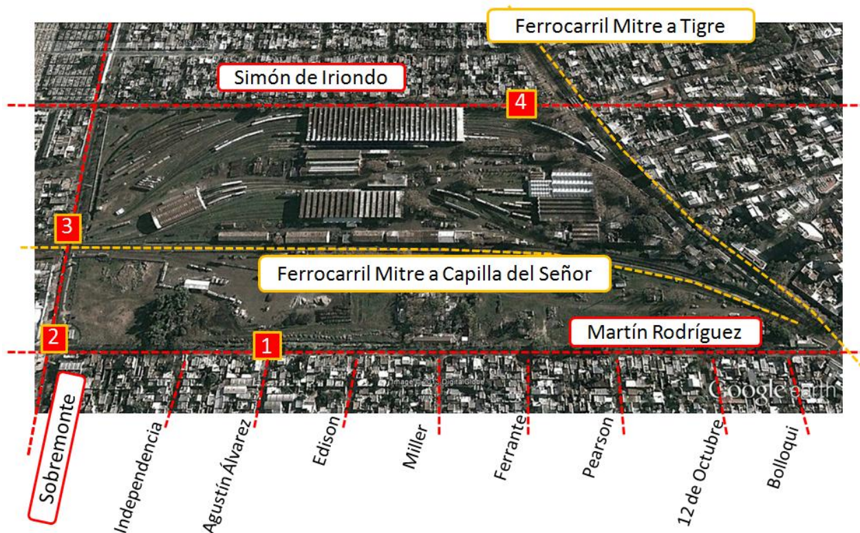
Figura N°2 - Hitos urbanos y puntos de acceso al predio.

Entre la estación Victoria y la calle Martín Rodríguez el uso del predio es mayormente residencial. A la altura de la calle Edison (Figura N°2) se inicia un antiguo muro perimetral, sin mantenimiento. En la intersección de Martín Rodríguez y Agustín Álvarez se puede acceder a un obrador operado por la empresa Ferromel ; la actividad en el espacio no es intensiva.