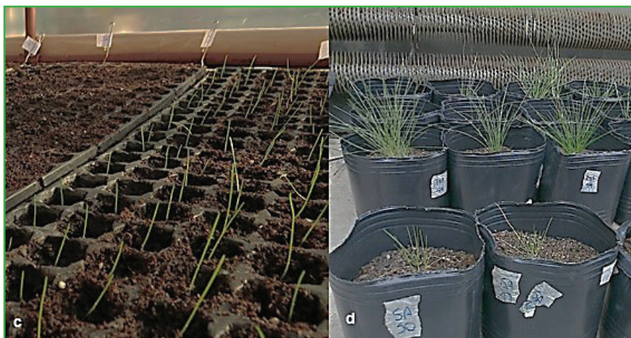
Figura 3: c) Semillas con una hoja desarrollada, y d) Plantas de seis meses utilizadas en un ensayo de estrés hídrico.