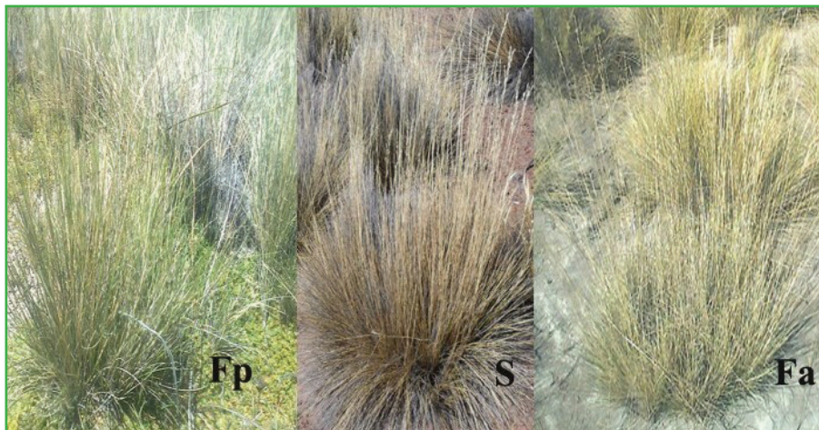
Figura 1: Coirones de las tres festucas: Fp ( F. pallescens ), S (festucas de Somuncura), Fa ( F. argentina ).

través del estudio de los patrones de variación genética de la especie. Para esto, realizamos un muestreo de 14 pastizales de Patagonia Norte, siguiendo el gradiente de precipitaciones que varía de 2000 mm en los alrededores de Bariloche hasta 150 mm en la meseta de Somuncurá. De cada pastizal tomamos una muestra de hojas y de semillas. Ya en el laboratorio, y por medio de marcadores moleculares de ADN, pudimos analizar en forma comparativa los acervos genéticos de cada pastizal. Los resultados de diversidad genética indicaron que las mayores diferencias ocurren entre los extremos del gradiente. Más aún, los coirones de Somuncurá, una región caracterizada por la presencia de especies endémicas 1 , resultaron ser genéticamente muy parecidos a Festuca argentina , una especie conocida como coirón huecú. La festuca de Somuncurá se trataría de un ecotipo morfológicamente muy similar al coirón blanco, y es posible que se haya originado por una hibridación natural muy antigua entre ambas especies.