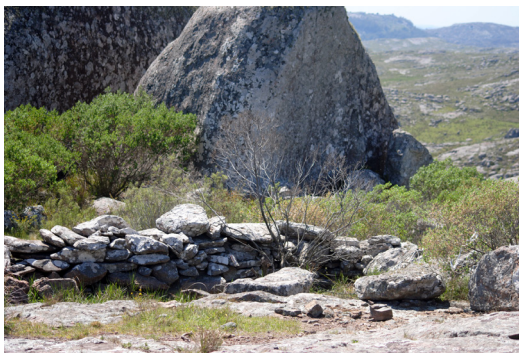
Figura 3: Sitio arqueológico “Corral de piedra Base Azopardo 1”, ubicado en la Reserva.

biente serrano (Kristensen y Frangi 1996; Kristensen et al. 2014; Raffo 2009). Cabe destacar, además, que estas sierras tienen una valiosa antigüedad geológica (entre 2.200 y 1.800 ma) (Teruggi y Kilmurray 1980), presentan afloramientos de rocas diversas, son cabeceras de numerosas cuencas y subcuencas de arroyos y de cursos temporarios (Bonorino et al. 1956) y mantienen una elevada riqueza florística (D'Alfonso et al. 2011; Requesenz et al. 2004). En cuanto a los aspectos culturales, se destaca la presencia de sitios arqueológicos prehistóricos e históricos que evidencian una amplia actividad humana desde hace miles de años. Concretamente se puede mencionar por ejemplo, la presencia de estructuras conocidas genéricamente en la región como “corrales de piedra” (Pedrotta 2005; Pedrotta y Duguine 2013; Slavsky y Ceresole 1988; entre otros) (Figura 3), y un patrimonio vinculado a pueblos y estancias conformadas como consecuencia del avance del Estado Nacional durante el siglo XIX sobre los territorios indígenas (Lanteri 2002; Ratto 1994; Sarra-mone 1993). Además, de acuerdo al nombre originario que recibía el lugar Pullu Callel (Sierras de los Espíritus en idioma mapuzungun 5 ) se cree que habría sido un sitio de valor espiritual (Tello 1946), lo cual amplía y enriquece la dimensión intangible de su patrimonio. A esto se suma la importancia paisajística y turística antes mencionada (Sánchez 2009).