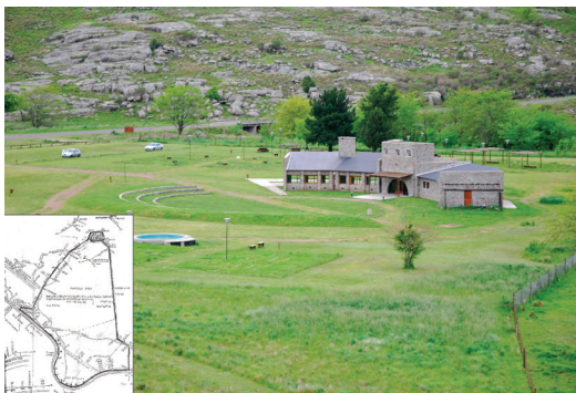
Figura 2: Parcela de la Reserva y Parador Boca de la Sierra.

Poniendo a la RNBS en contexto, las sierras de Tandilia pueden considerarse una ecoregión específica del territorio bonaerense (pampa húmeda) con importantes funciones ecológicas y socioculturales (Kristensen et al. 2014; Raffo 2009, Sánchez y Núñez 2004). Este ambiente adquiere relevancia ya que sus posibilidades limitadas para la explotación agrícola permitieron el resguardo de una riqueza específica de hábitats y endemismos del am-