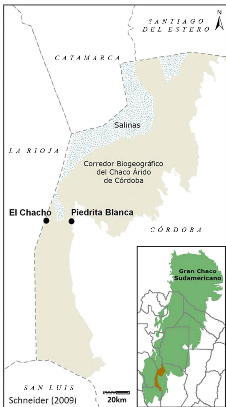
Fig. 1. Área de Estudio.

las sierras de Pocho y Guasapampa. El paisaje, en general, está caracterizado por la escasez de aguas superficiales —tanto corrientes como estancadas (ANPs de Córdoba 2005). En líneas generales el suelo del piedemonte es poco profundo, contiene pocos nutrientes, es arenoso y permeable, y arcilloso y fino en la llanura (Demaio & Medina 1999).