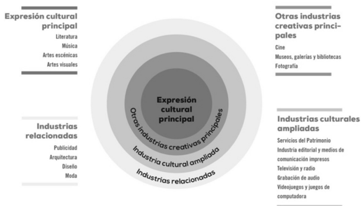
Figura 1 Modelo Círculos Conéctricos propuesto por Throsby