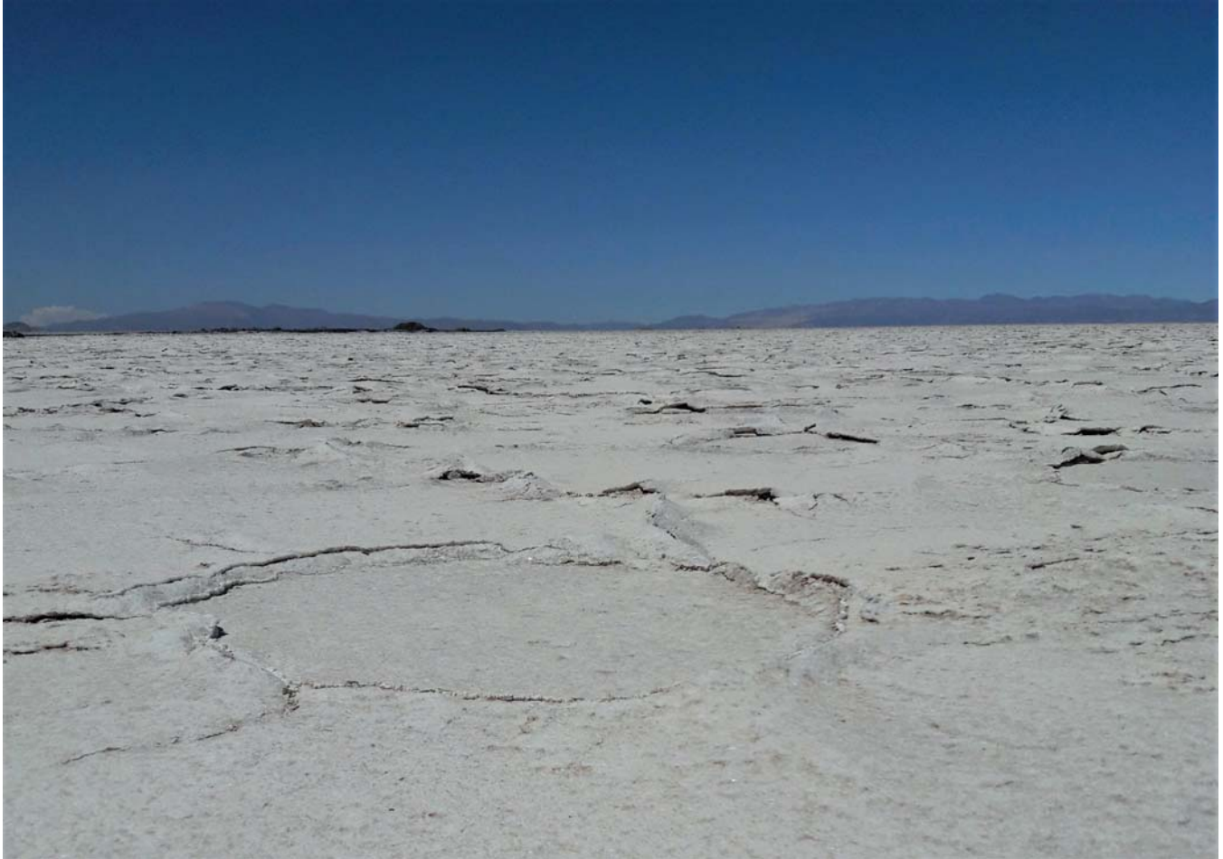
Figura 1. Las Salinas Grandes.

El agua que aún no se evaporó completamente es salobre (es decir, algo salada). Cuando los ríos llegan a un salar, el agua se almacena en su interior. Como en este ambiente el agua está en contacto con las sales, se vuelve, previsiblemente, salada. Justamente, esta agua salada contenida entre las sales y los sedimentos de las cuencas salinas es la que constituye las salmueras que, en el caso de los Andes, son las que almacenan altas concentraciones de litio. De este modo, la minería andina del litio consiste en el aprovechamiento de las salmueras de los salares (Figs. 2 y 3).