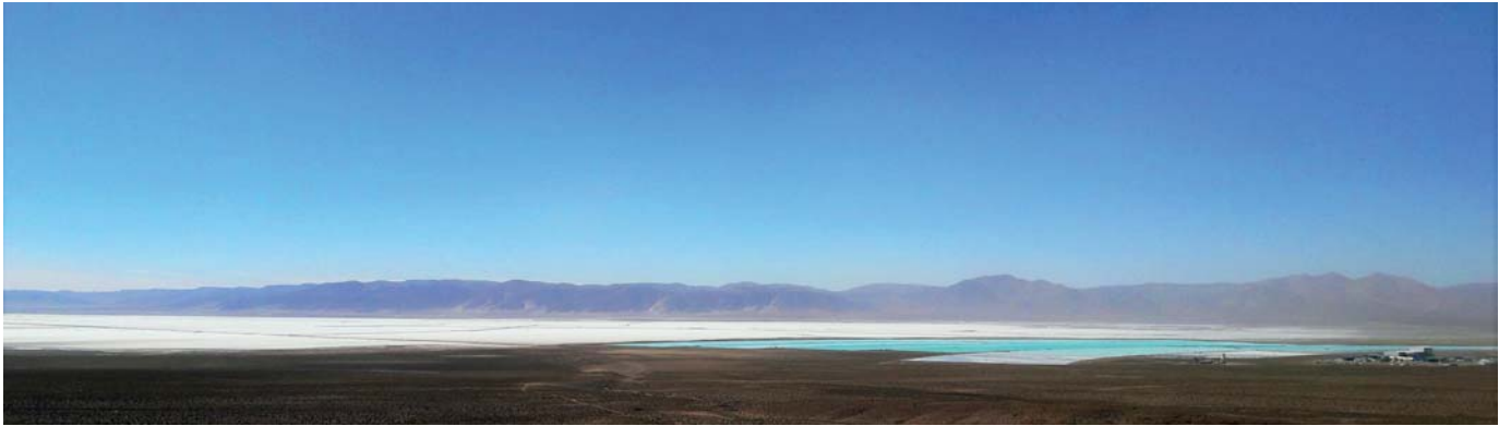
Figura 2. Superficie salina (izquierda) y pozas de evaporación de salmuera para recuperación de litio (derecha) en el salar de Olaroz.

En el plateau andino existen numerosos salares (Fig. 4). Solo en la parte argentina del plateau existen más de 20 cuerpos salinos que merecen interés en términos de su potencial litífero. Este potencial se define en virtud de una serie de características, entre las cuales abordaremos las dos más elementales: la concentración de litio y el tamaño del salar. La concentración de litio en una salmuera representa la cantidad de este elemento (generalmente en miligramos) que está disuelta en un litro de salmuera. Desde ya que, mientras mayor sea la concentración de litio en la salmuera, mayor será la importancia del salar en términos económicos. Cuando las concentraciones de litio en las salmueras son lo suficientemente interesantes, otro aspecto que favorece la relevancia económica de un salar es su tamaño, ya que mientras más grande sea el cuerpo de sal, mayor será el volumen de salmuera contenido y, por ende, la cantidad de litio presente. Detallaremos a continuación estos dos rasgos para algunos de los más importantes prospectos de litio en los Andes de Bolivia, Chile y Argentina (Tabla 1).