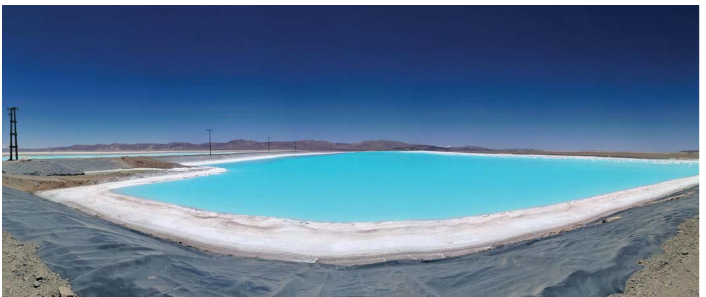
Figura 3. Poza de evaporación de salmuera para recuperación de litio en el salar de Olaroz.

En el plateau andino existen numerosos salares (Fig. 4). Solo en la parte argentina del plateau existen más de 20 cuerpos salinos que merecen interés en términos de su potencial litífero. Este potencial se define en virtud de una serie de características, entre las cuales abordaremos las dos más elementales: la concentración de litio y el tamaño del salar. La concentración de litio en una salmuera representa la cantidad de este elemento (generalmente en miligramos) que está disuelta en un litro de salmuera. Desde ya que, mientras mayor sea la concentración de litio en la salmuera, mayor será la importancia del salar en términos económicos. Cuando las concentraciones de litio en las salmueras son lo suficientemente interesantes, otro aspecto que favorece la relevancia económica de un salar es su tamaño, ya que mientras más grande sea el cuerpo de sal, mayor será el volumen de salmuera contenido y, por ende, la cantidad de litio presente. Detallaremos a continuación estos dos rasgos para algunos de los más importantes prospectos de litio en los Andes de Bolivia, Chile y Argentina (Tabla 1).