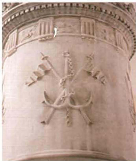
Columna central, que sostiene la virtud teologal de la fe.