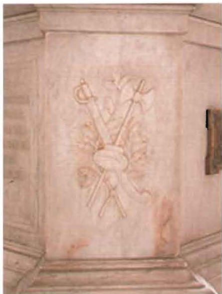
Detalle de la ornamentación del basamento