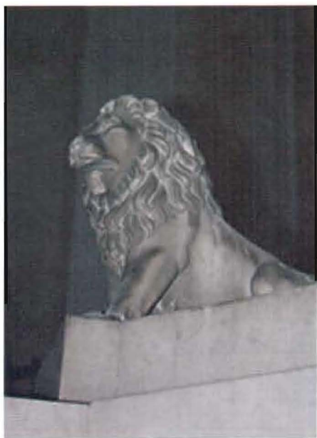
Uno de los cuatro leones que se ubican sobre el basamento.