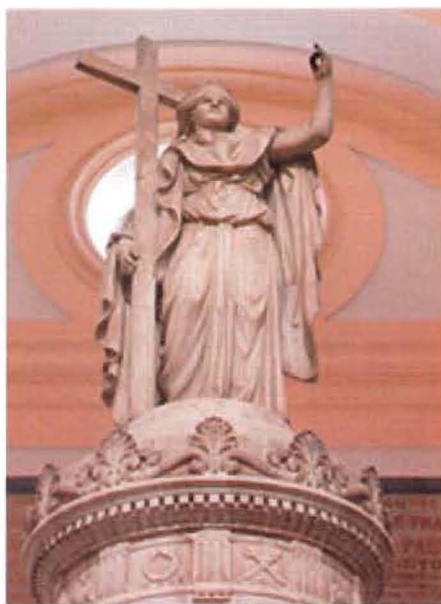
Detalle de la virtud teologal de la fe, que corona el monumento.