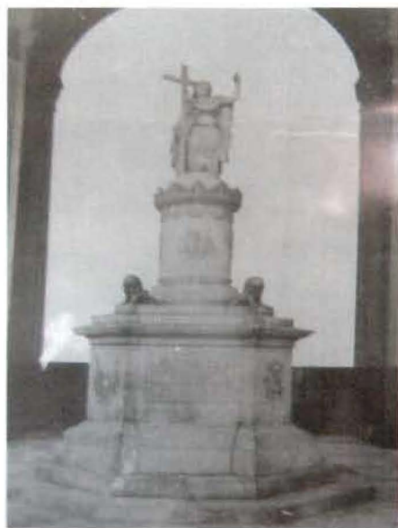
Antigua fotografía de principios del siglo xx. Nótese que aún no tenía el muro posterior con su óculo.