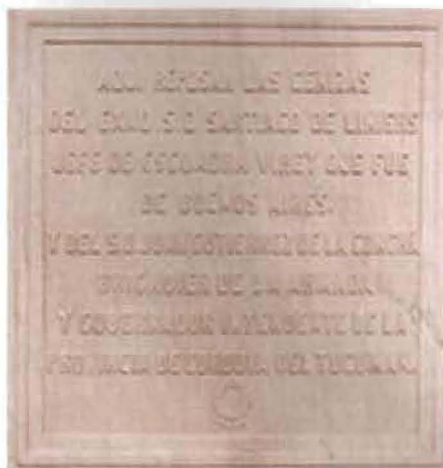
Placa frontal del monumento.