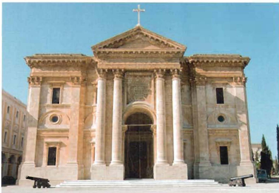
El Panteón de Marinos Ilustres en la actualidad.