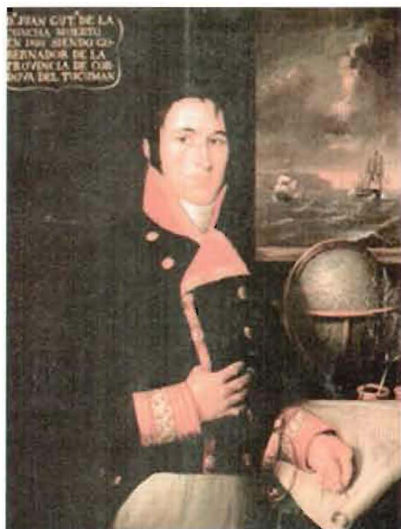
Gutiérrez de la Concha, óleo anónimo del siglo xx. Museo Naval de Madrid.