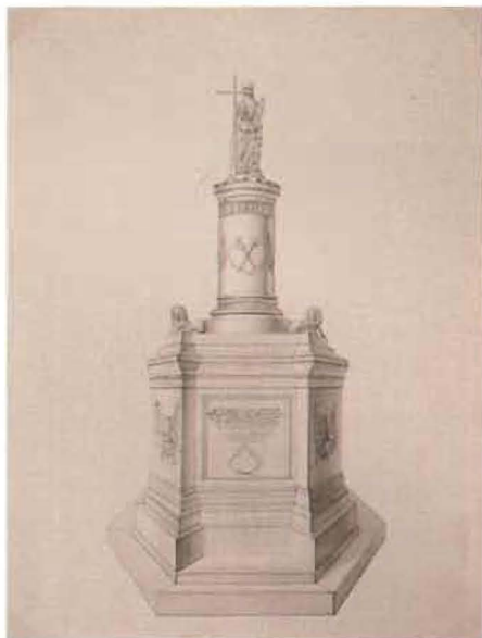
Plano en perspectiva del monumento que presentó el marqués del Duero a fines de 1863. Museo Naval de Madrid.