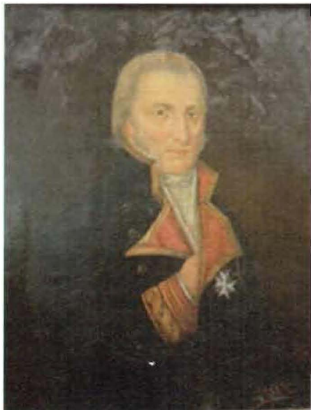
Liniers, óleo de Rafael del Villar. Museo de la Marina del Tigre, Buenos Aires.