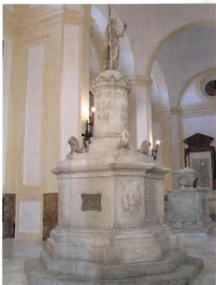
Vista general del monumento a Liniers-Gutiérrez de la Concha en el Panteón de Marinos Ilustres.