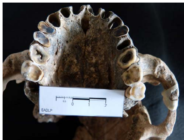
Figura 3. Arcada dental superior de un individuo de Pavenham, en el cual se puede observar claramente el fuerte desgaste presente en premolares y molares.