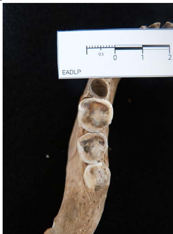
Figura 2. Fragmento correspondiente a una hemi-mandíbula izquierda, recuperada en el sitio Pavenham, en la cual se puede observar el desgaste presente en primeros, segundos y terceros molares inferiores.

grado de desgaste de las piezas dentales en poblaciones con sistemas de subsistencia de tipo cazador-recolector y agrícola.