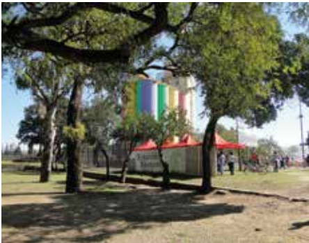
Figura 5. Estación Saludable, frente a los silos del Museo de Arte