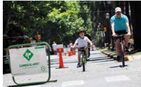
Figura 4. Recorrido y cartelera sobre Bulevar Oroño