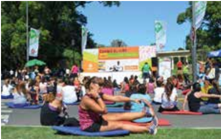
Figura 3. Estación de ejercicio de piso y elongación