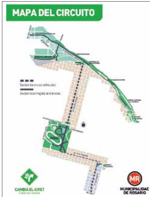
Figura 1. Plano oficial. Vía Recreativa Rosario

automóvil. Partiendo de las experiencias de Masa Crítica, procedentes de San Francisco y replicadas alrededor del planeta (Hou, 2010), la administración local ha conseguido que el Banco Interamericano de Desarrollo reconociera a Rosario como la ciudad de Latinoamérica en la que se produce el mayor uso de las bicicletas.