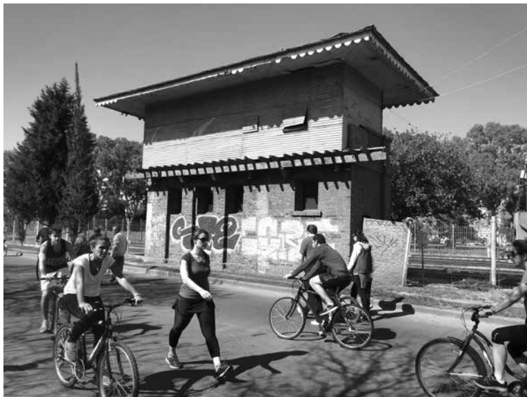
Figura 7. Residuos ferroviarios y Vía Recreativa Rumbo Puerto Norte