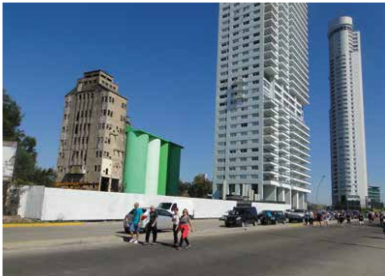
Figura 8. Torres Countries. Vía Recreativa y Ruinas ferro-portuarias en proceso de “Rehabilitación”