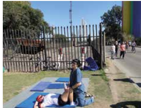
Figura 6. Masajes a un lado Playa de Maniobras del FCCA, al otro Museo Macro Av. Carvalho