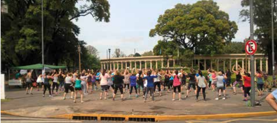
Figura 2. Estación de ejercicios y ritmos. Parque de la Independencia (Bv. Oroño y Pellegrini)