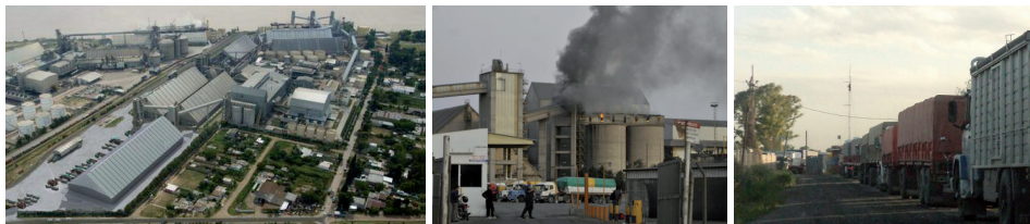
FIGURA II EMPRESA MOLINOS RÍO DE LA PLATA, DISTRITO SUR SAN LORENZO

Imagen de la derecha, camiones en dirección a las terminales, avanzando por el tejido urbano.