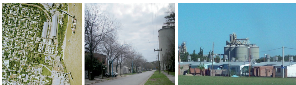
FIGURA I SILOS EN BARRIO CENTRO. EMPRESA BUNGE-PUERTO GENERAL SAN MARTÍN