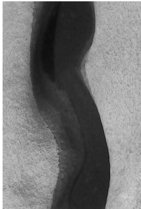
Imagen 2. Petroglifo en Río Quilpo. Referencia del territorio Comechingón.

M. Sí, seguro, es poner límites a cosas que para nosotros no tienen límites. Cuando nosotros cosechamos o sembramos, como es compartido, los tiempos de cosecha o de siembra son compartidos también. Todas las familias acuden a... ponele “acá hay una parcela de siembra, esta es una parcela de recolección, esta es una parcela de pastoreo” [dibuja en el mapa], por así decirte ¿No? Acá puede haber arcilla. Toda esta zona es compartida, esta familia va a ir a buscar arcilla