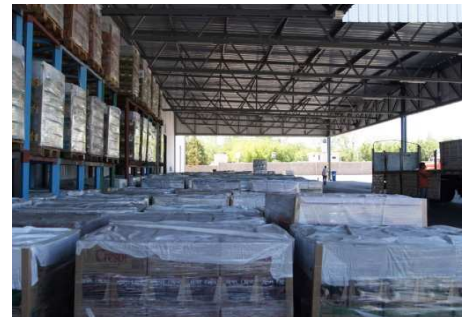
Tabla 3. Características dimensionales y de materialidad de la Bodega Santa Ana