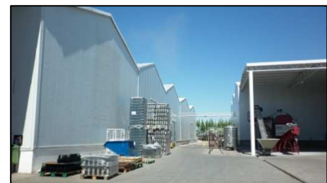
Tabla 4. Características dimensionales y de materialidad de la Bodega Zuccardi