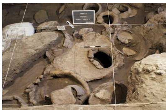
Figura 1. Sitio arqueológico en Areni, Armenia.

Sobre las mejores condiciones de preservar el vino, desde la edad Antigua, se conoce la sensibilidad del vino a la temperatura, por lo que se construyeron construcciones protegidas del sol. En otros casos, gruesos bloques de tierra fueron usados en depósitos, como es el caso de las bodegas de Rameses II en Tebas. (Yravedra Soriano, 2003) (Figura 2). Sabemos que los recipientes [conteniendo vino] se ubicaban en depósitos frescos y oscuros. (Ruiz Mata, 1995).