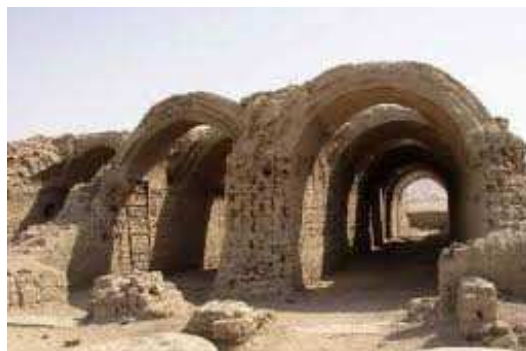
Figura 2. Bodegas de Rameses II en Tebas, Egipto.

Podemos afirmar entonces que las bodegas primitivas eran cuevas encontradas o excavadas en la tierra, o espacios especiales construidos a dicho fin con materiales con alta inercia térmica como piedras, tierra o adobe. Ambas soluciones presentaban una estructura completa de resistencia térmica y por lo tanto mucha estabilidad en las temperaturas interiores necesaria especialmente para la elaboración del vino.