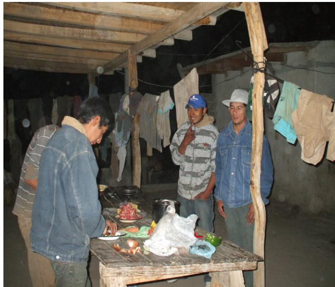
Foto 2. Trabajadores preparando su cena al regreso de una intensa jornada de trabajo.