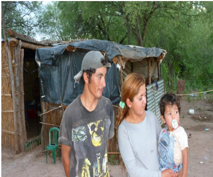
Foto 1. Residencia de matrimonio joven migrante en Santiago del Estero.

Se observa la preponderancia de la residencia rural por sobre la urbana, sin embargo vemos que esa residencia no es decisiva en los porcentajes que expresan las otras variables. Los migrantes urbanos tienen un poco más de ocupaciones a lo largo del año que los rurales. Esto tal vez se explica por la ausencia de tierra para el trabajo y por ende con la necesidad de permanecer en el mercado de trabajo. No obstante, la residencia rural no determina menores meses de asalarización para los migrantes, ya que 7 de cada 10 trabajan fuera de su residencia por más de 6 meses en el año. Este resultado convalida la idea de hogares rurales de asalariados y por otro lado la baja incidencia de la actividad agropecuaria como fuente de ingresos en este perfil de trabajadores. Por lo tanto, las cuestiones de mutación laboral como las alternativas de ofertas del mercado de trabajo resultan ineludibles para comprender la subsistencia y reproducción de este tipo de mano de obra.