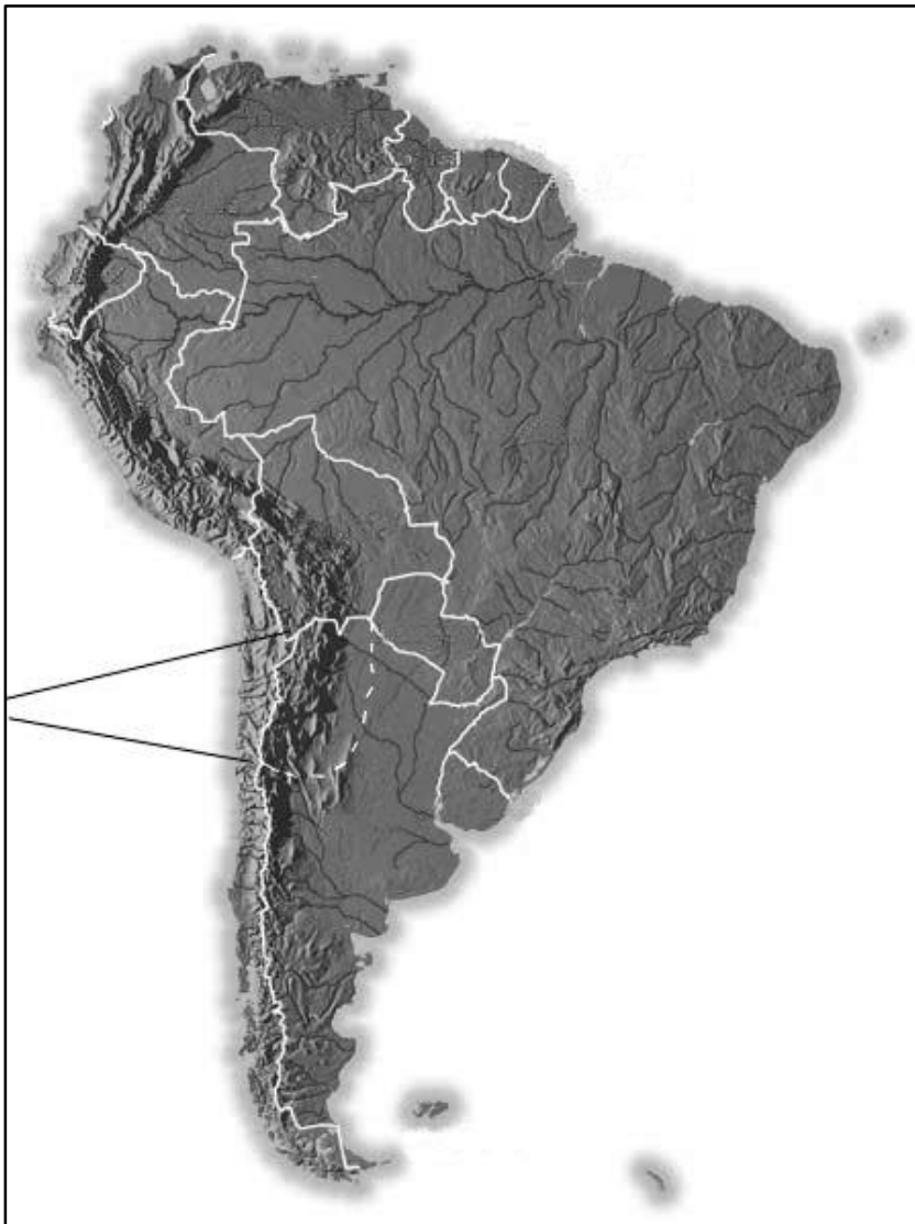
Figura 1- Ubicación del Noroeste argentino en Sudamérica

Nuevo auge y diferentes abordajes (ca. 1983-al presente): Los problemas arqueobotánicos fueron retomados a partir de nuevos planteos teórico-metodológicos y se abrieron líneas de trabajo interdisciplinarias.