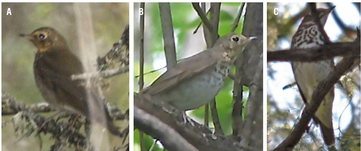
Figura 2. Zorzalito Boreal ( Catharus ustulatus ) en la provincia de Córdoba, Argentina. (A) en bosque de exóticas, el 3 de enero de 2014, en el río Salsipuedes, departamento Colón; (B) Perchado en un algarrobo ( Prosopis sp.), el 6 de octubre de 2010, Establecimiento Guayascate, departamento Tulumba; y (C) el 14 de noviembre de 2014 en el patio de una vivienda en Miramar, departamento San Justo.

Los primeros registros del Zorzalito Boreal para la provincia de Córdoba fueron en La Isla, localidad cercana a Alta Gracia, con fechas del 9 y 25 de febrero de 1978 (Nores et al. 1983). La mayoría de los registros de la especie en Córdoba provienen de las Sierras Chicas, y su presencia parecería ser regular -aunque probablemente escasa-, tanto en las laderas occidentales (Volkman & Cargnelutti 2001) como en las orientales (Miatello et