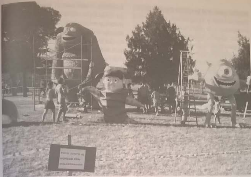
2 Clásico paseo admirando los muñecos, todos los 31 de diciembre.

tareas propias de construcción del muñeco: armado de la estructura de madera o metálica (que tiende a desaparecer), relleno, clavado, empapelado, pintado del muñeco; en algunos casos indistintamente varones y mujeres y, en muchos otros, existen tareas que sólo realizan los varones - clavado y soldadura - mientras las mujeres pueden realizar empapelado y pintura (cuando quieren o las dejan), de lo contrario hacen compañía, ceban mate o piden dinero junto a los niños. Cuando se hace presente la colaboración de adultos - mayores de treinta y cinco años, aproximadamente - tiene que ver con el manejo de dinero recaudado, la supervisión de elementos pirotécnicos, la solicitud de permiso municipal (cuando existe), que compromete al firmante a cumplir con la Ordenanzas Municipales