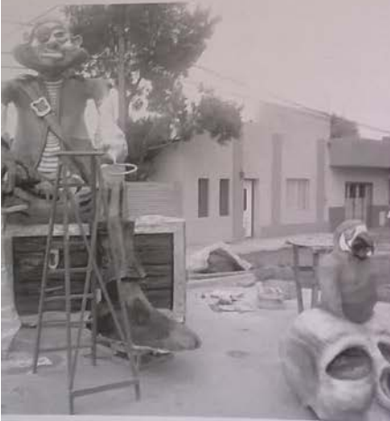
1 El barrio ya no es el mismo de la cotidianeidad.

Así, en este arte de la cultura popular al embellecer "el objeto" ritual, dotándolo de toda la creatividad, es el modo de asegurar su eficacia en la ceremonia; concordamos con Ticio Escobar quien nos recuerda "que en el terreno popular, donde no hay belleza, no hay eficacia". Es así, que la función estética, en este arte popular, siempre debe