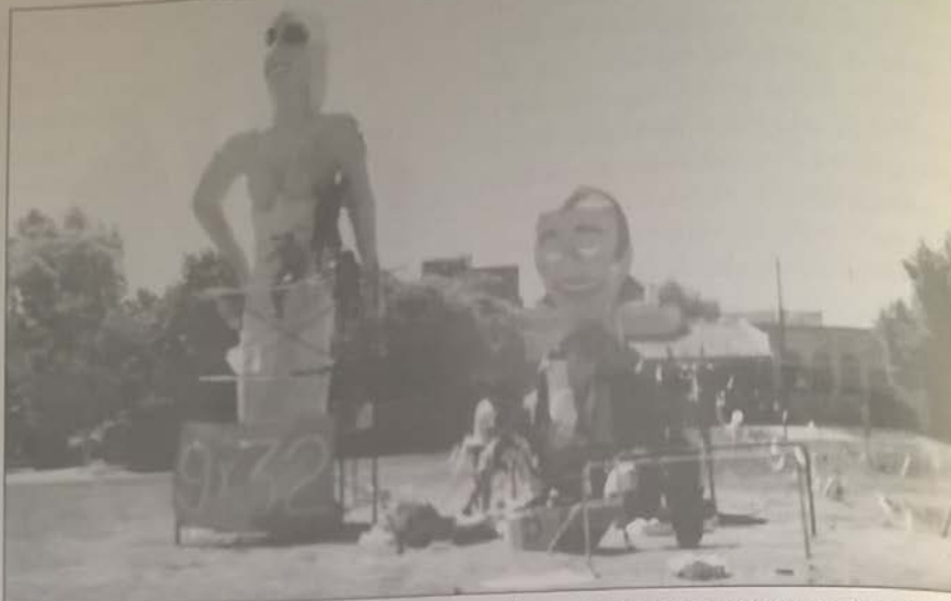
5 Casamiento ex miss universo y ex presidente. La cultura popular representó al evento con humor.

a perdurar; y por otro, con la fiesta de los muñecos de fin de año, concebidos y contruidos, para ser quemados de inmediato. En el primer caso, la eficacia simbólica de edificios y monumentos públicos reside en su conservación, como vestigio del pasado y proyección al futuro. En el segundo, a la inversa, este papel lo cumple la última etapa de la fiesta: la condena a la hoguera del muñeco, en el transcurso de la muerte del tiempo.