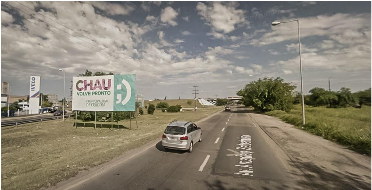
Imagen 2. Chau, volvé pronto.

Ahora bien, si nos centramos en el conflicto ambiental, podemos reconocer en las denuncias que el GMBIA realizó desde el comienzo de su lucha, varios elementos ya mencionados en este trabajo. La situación que dió comienzo al caso se explica a partir las enfermedades que surgieron en el barrio y que condujeron al GMBIA a preguntarse qué sucedía. La primer presunción fué el estado de la provisión de agua, desde hacía tiempo que reclamaban por la instalación de la red de agua potable en el barrio. Hasta ese momento solo contaban con agua de pozo, debido a que la infraestructura de la red de agua potable no se extendía hasta esa zona de la ciudad, como consecuencia la mayoría de la población del barrio consumía agua no potable ante dificultad económica de comprar agua envasada. Esta situación llevó a relacionar la posibilidad de que las enfermedades estuvieran vinculadas al consumo de agua contaminada, en consecuencia exigieron un análisis del estado del agua al Ministerio de Salud de la Provincia de Córdoba. Los análisis demostraron que los tanques domiciliarios contenían agroquímicos (endosulfán, heptacloro) y metales pesados (plomo, cromo, arsénico). Esto constituyó uno de los eslabones centrales para visibilizar el conflicto de las