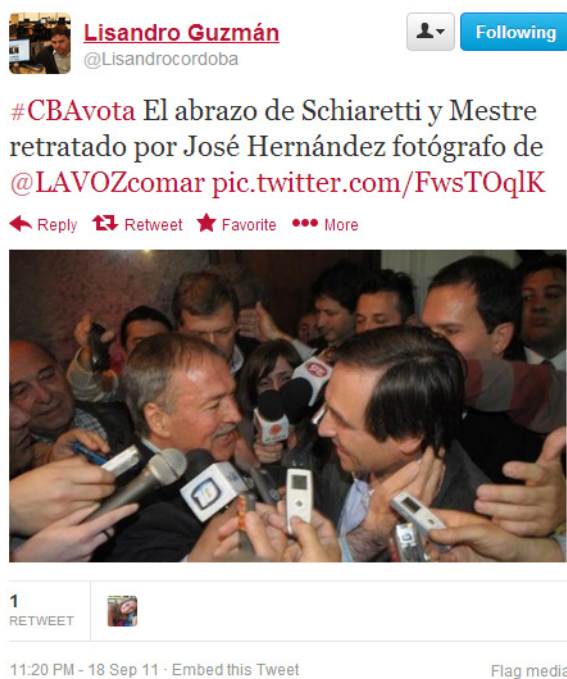
Figura 1. Ejemplo de tuit electoral con foto propia