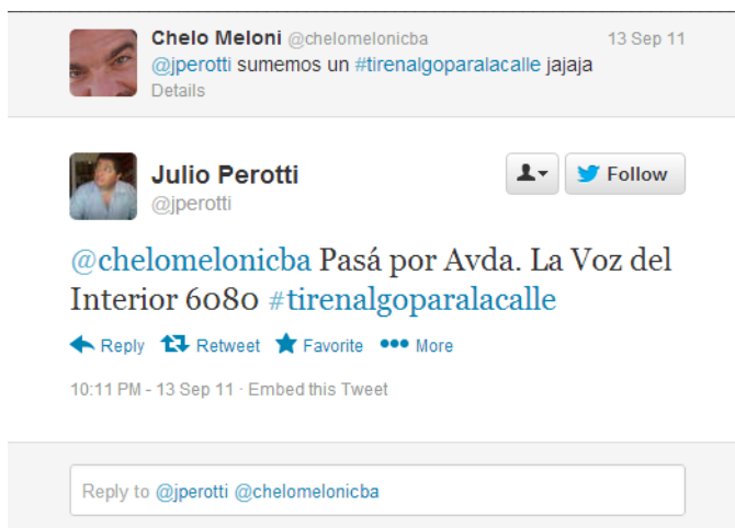
Figura 2. Ejemplo de tuit autorreferente de carácter informal