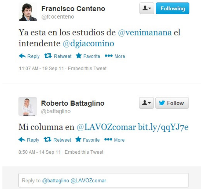
Figura 4. Ejemplos de tuits autorreferentes de carácter formal