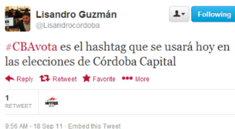
Figura 3. Hashtag “oficial” de la cobertura electoral local en Twitter