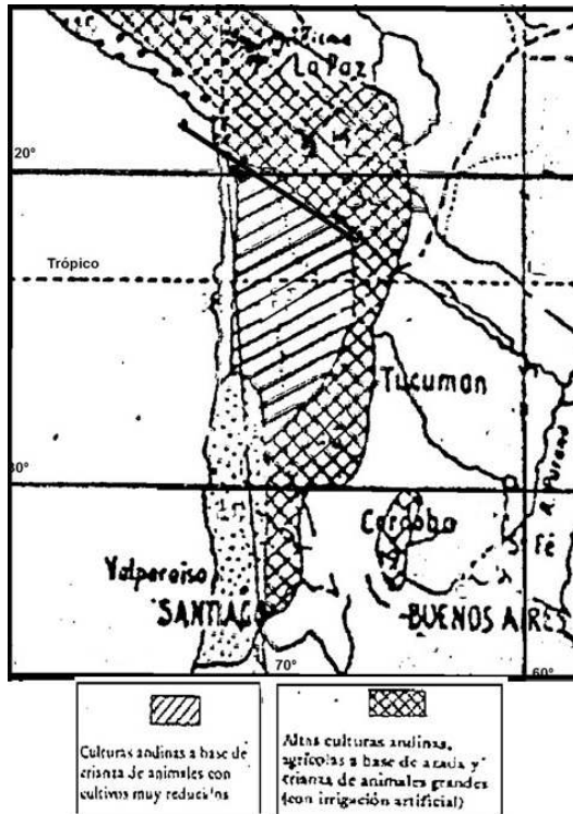
Mapa 2. Mapa actual de la zona estudiada y de los lugares mencionados.