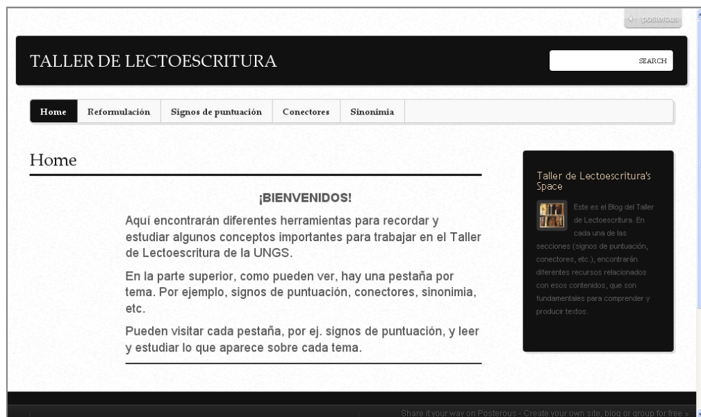
Figura 1. Blog del Taller de Lectoescritura.

En cuanto a la propuesta didáctica, se determinó, en primer lugar, que el FB se iba a combinar con un blog que funcionaría a modo de reservorio de los materiales teóricos, en formato pdf., sobre los contenidos involucrados en las actividades de reformulación. Así, el Blog fue diseñado con un encabezamiento en el que se indicaba el título “Taller de Lectoescritura” y una serie de pestañas con los siguientes títulos: Home , Signos de puntuación , Conectores , Sinonimia y Reformulación .