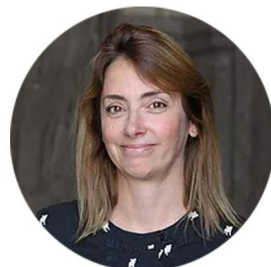
Sol Noetinger Diseño, comunicación y redes sociales