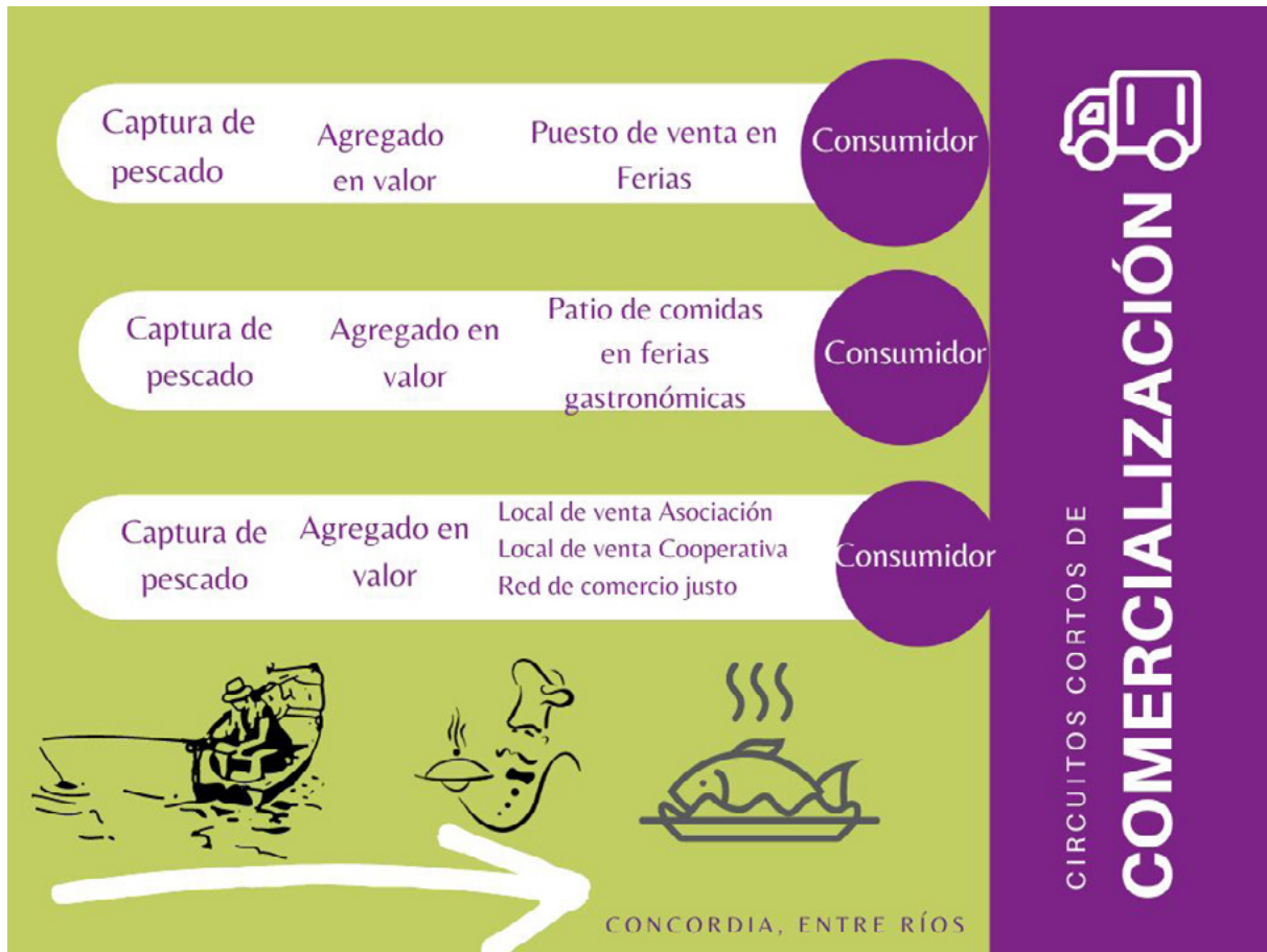
Circuitos cortos de comercialización de pescado de río en la localidad de Concordia.

En la ciudad de Concordia, la posibilidad de diversificar el destino de la comercialización de pescado de río se dio desde el momento en que los propios pescadores locales tomaron conciencia de las relaciones abusivas que sostenían con los acopiadores y cómo esto los perjudicaba económicamente. En este sentido, un pescador de Concordia señalaba que –a precios del año 2019– un acopiador clandestino pagaba el kilo de pescado a $40. Pero analiza que si, en vez de entregar su producto a un acopiador, le suma valor agregado, le saca mayor precio y necesita pescar menos kilos por día. Con relación a ello, hace el siguiente razonamiento: