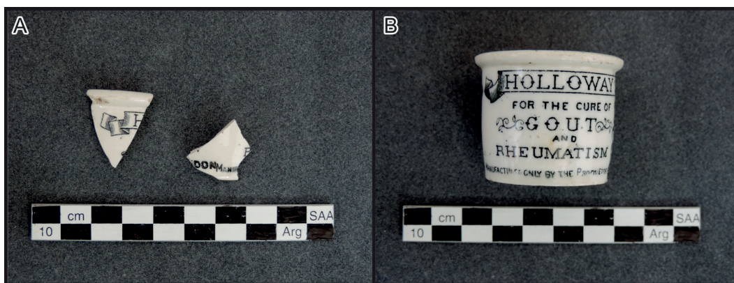
Figura 3. Ungüento y pomada Holloway’s. A- Material del sitio Estancia Bertón. B- Material de referencia.

En los trabajos arqueológicos se recuperó un conjunto numeroso y variado. Se asignan al conjunto vítreo 2048 elementos, con distintos estados de fragmentación, que corresponden en su mayoría a contenedores de bebidas. Se identificaron 31 fragmentos