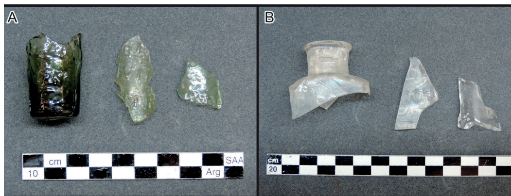
Figura 2. Materiales vítreos de Estancia Bertón. A- Tónico alemán Kronessents B- Botellas de perfumería y/o farmacia.

También están presentes fragmentos vítreos de color verde claro y verde claro amarillento, correspondiente a una base y distintos fragmentos asignados al cuerpo de la botella. La base, de 2,3 cm de diámetro, posee paredes de grosor irregular y marca de pontil. En forma circular descendente se encuentra la inscripción «DIE KEISERLICHE PRIVILEGIERT ALTONATICHE W. KRON ESSENTS» ("La privilegiada y milagrosa esencia imperial Kron de Altona"). Se identifica un mínimo de tres pequeñas botellas de este tónico de origen alemán, cuya licencia de venta se remonta a 1796 y se extiende durante todo el siglo XIX (Figura 2A). Este producto ha sido identificado en sitios contemporáneos, como Puesto Pacheco en La Pampa (Berón et al. 2004), el Fuerte General Paz, en el oeste de la provincia de Buenos Aires (Tamburini et al. 2020) y la residencia Anchorena en Buenos