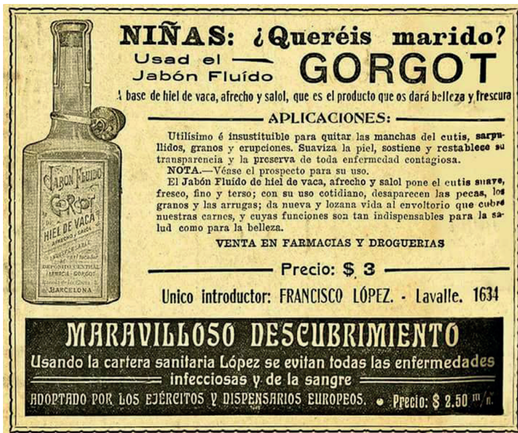
Figura 5. Publicidad de 1910 del Jabón Fluído Gorgot.

como jabones y perfumes. Por ejemplo, una botica llamada "Botica Nueva", de Cañuelas, ofrecía preparaciones químicas, medicinas, perfumería fina y artículos de tocador, y garantizaba "fiel y exacto despacho de las prescripciones de los señores médicos" ( El Sudoeste de Cañuelas , 1885). Esto lo vincula con las pequeñas botellas y recipientes, en los que generalmente se indica el volumen (como los hallados en Primera Estancia), que eran rellenados con preparaciones medicinales en boticas y farmacias a partir de la correspondiente prescripción médica. También se registra el aviso de la farmacia