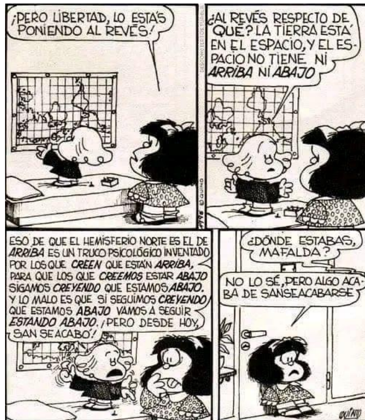
Figura 4. Mafalda, Quino.

Fuente: Quino (2001), Toda Mafalda , Ed. La Flor