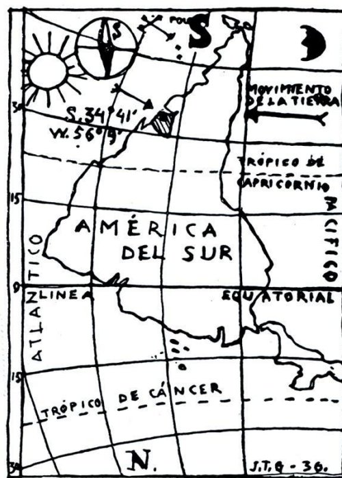
Figura N° 2. Mapa de América, 1936. Tinta sobre papel Museo Torres García, Montevideo, Uruguay.