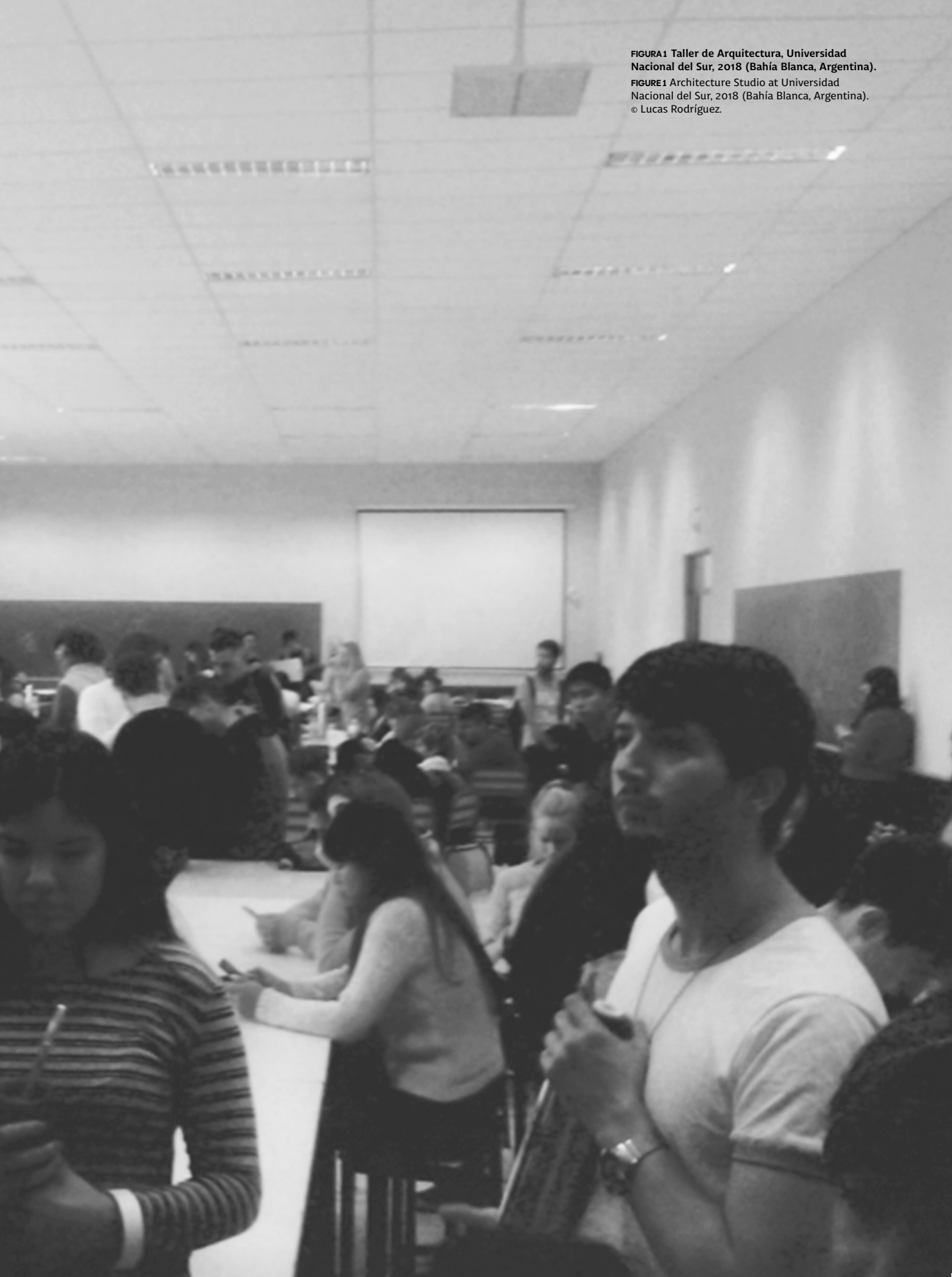
FIGURA1 Taller de Arquitectura, Universidad Nacional del Sur, 2018 (Bahía Blanca, Argentina). FIGURE1 Architecture Studio at Universidad Nacional del Sur, 2018 (Bahía Blanca, Argentina). © Lucas Rodríguez.