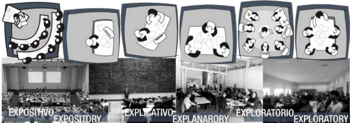
FIGURA 2 Modelos y estrategias pedagógicas, de lo expositivo a lo exploratorio. FIGURE 2 Pedagogical models and strategies, from the expositive to the exploratory.