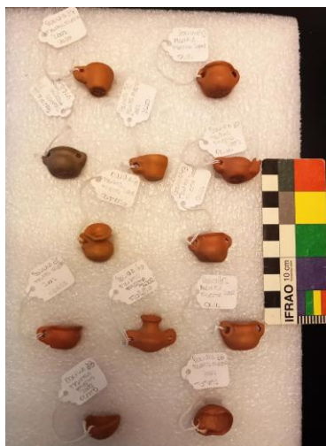
Figura 10. Dedales miniaturas de la Manka Fiesta o Fiesta/Feria de las ollas desarrollada en La Quiaca, Jujuy, Argentina. 2002.