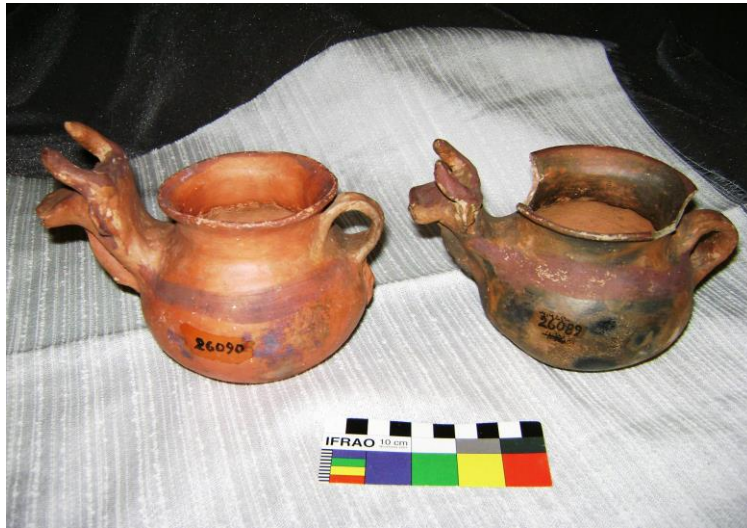
Figura 4. Piezas MET N° 26089 y N° 26090.

El siguiente caso es un pequeño cántaro (Fig. 5 a y b) en donde se ratifica que la cosmovisión dual andina continúa, pero se actualiza en su repertorio formal. Representa un animal vacuno, animal de origen hispano, modelado con el detalle de sus características pezuñas, rabo y manchas.