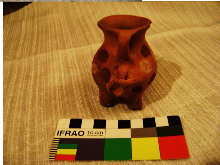
Figura 5 a y b. Pieza MET N° 26091, asentada como cántaro zoomorfo.

Junto a este caso en donde se observan más claramente nuevos elementos de diseño, hay otros más sencillos, como el siguiente cántaro (Fig. 6 a y b), en donde aparece un borde evertido al estilo español junto con un acabado con diseños arriñonados pintados en colorado y contorneados en blanco que no son tan claros desde un punto de vista representativo. Pero podríamos decir que todo ello, junto con la aplicación o “marca” en el asa, se vinculan a modos de hacer andinos ya estudiados para casos del influjo del incario y la colonia temprana en la región del NOA (López, 2007 a).