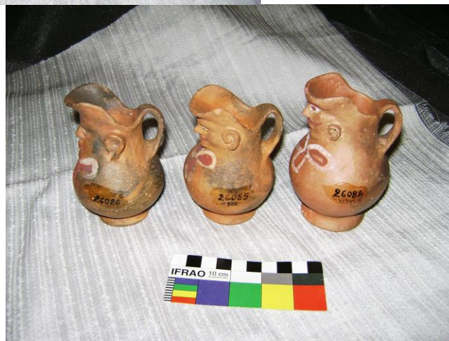
Figura 7a y b. Piezas de alfarería asentadas en el Libro del MET con los N° 26084, 26085 y 26086 y definidas como cántaros antropomorfos.

En estos tres casos observamos nuevamente formas prehispánicas con acabados novedosos (borde evertido y decoración). En cuanto a lo pictórico y siguiendo también el concepto de “marca de alfarero” (López, 2007 a) es importante observar que más allá de la escala de la producción, de acuerdo con observaciones que realizamos en Casira Argentina, poblado conocido por sus alfareras quienes producen para su consumo, pero también para el intercambio y venta, las marcas las realizan mayormente los hombres. Entonces si vinculamos los datos documentales anteriormente mencionados para Tupiza con los de nuestros trabajos etnográficos en Casira, no es claro el tema de la producción, o sus distintas etapas (secuencia de producción) en relación con el sexo.