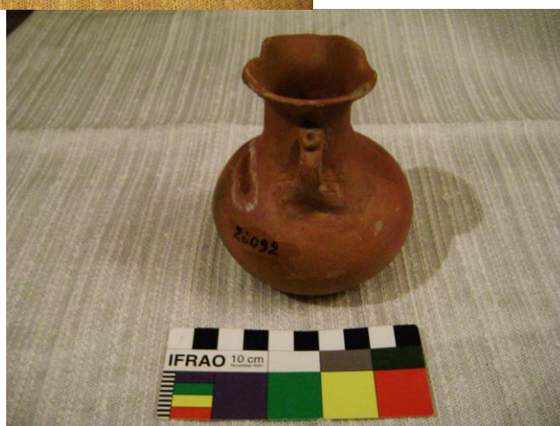
Figura 6 a y b. Pieza MET N° 26092, asentada como cántaro rojo decorado.

Para terminar con esta forma también observamos otros tres casos (Fig. 7 a y b) en donde se pronuncia aún más el borde evertido al estilo español, mostrando una representación antropomorfa en el cuello en donde los rasgos epigenéticos podrían hacer referencia a la categoría de mestizo, junto con una representación pictórica de adorno corporal, pero con el estilo decorativo que veíamos más desvanecido en el caso anterior. Esta repetición de “decoración” sería un indicador más de una posible marca de alfarero, no necesariamente de uno sino de una familia o grupo. Pues se trata del mismo concepto, pero los trazos son notablemente distintos, tanto en los bigotes de estos señores como en sus pecheras. Esta caracterización permite suponer que estas piezas fueron compradas a un mismo artesano, familia o grupo, hipótesis muy posible considerando que Debenedetti entra en contacto con las comunidades, incluso participando de algunas de sus actividades.