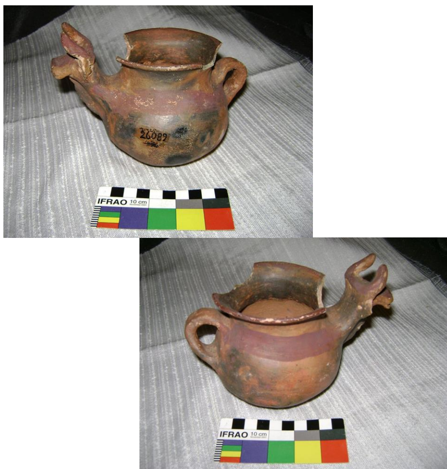
Figura 3 a y b. Pieza MET N° 26089, asentada como cántaro zoomorfo. Fotos del autor.

La posibilidad de haber sido utilizados de a pares (Fig. 4), podría insertar este tipo de pieza en la cosmovisión dual incaica. No obstante, todo ello, desde el punto de vista representativo la forma de plasmar el camélido se vincula más con la lógica y cosmovisión occidental que, de acuerdo con las investigaciones que se vienen llevando a cabo desde los años 1980 en adelante por la Historia y Teoría del Arte del mundo andino, habría impactado fuertemente por sobre la predominante abstracción incaica (Cummins, 1993 y 1998; Gisbert, 2004 [1980]). En la región de la Quebrada de Humahuaca (NOA) un trabajo anterior (López, 2006) constituye un ejemplo concreto de superposición o combinación de ambas lógicas sobre material cerámico.