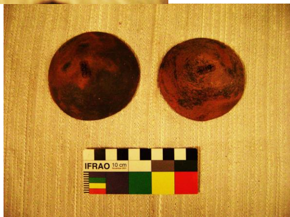
Figura 8 a y b. Piezas MET N° 26097 y N° 26098, asentadas como platitos rojos decorados.