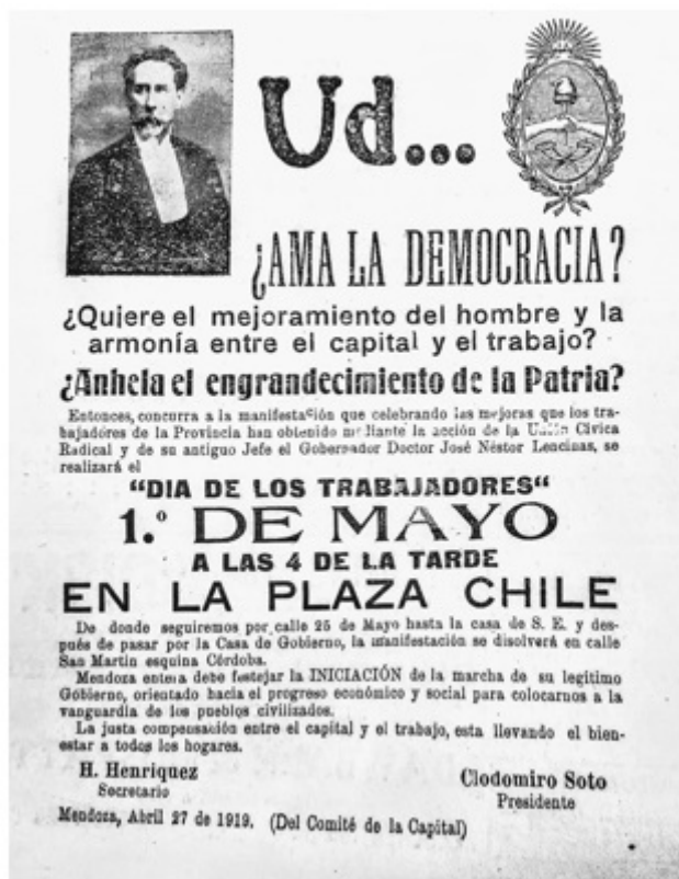
FIGURA 2 Convocatoria lencinista a la movilización del 1° de mayo de 1919

La exaltación de los preceptos lencinistas realizados a fines del año 1918 encontraba una arena propicia para ser celebrados durante la jornada del 1° de Mayo del año siguiente. Tal como se desprende del panfleto convocante realizado por el Comité radical de la Capital, se jerarquizaba el amor por la “democracia” y el mejoramiento del “hombre” concebido a partir de la “armonía entre el capital y el trabajo”, únicos pilares válidos para el engrandecimiento de la “Patria”. Para ello se proponía un tránsito de cara al futuro en el que “la justa compensación entre el capital y el trabajo” garantizaría “el bienestar a todos los hogares” (Figura 2).