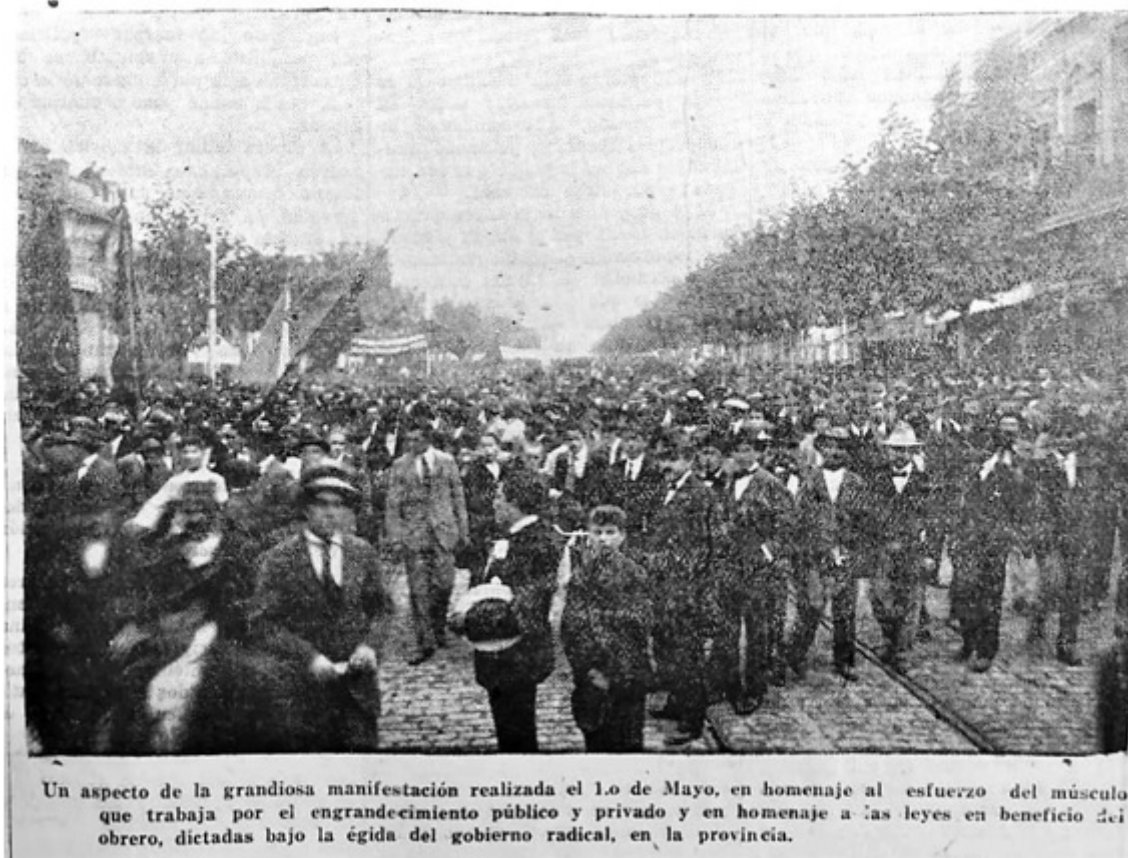
FIGURA 4 Manifestación callejera del 1° de mayo de 1919