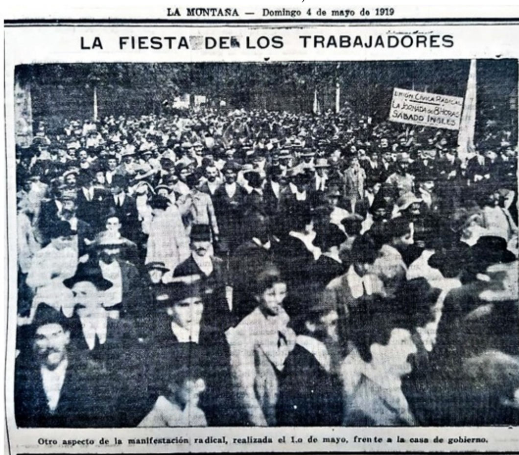
FIGURA 3 “La fiesta de los trabajadores”

Una de las tomas fotográficas, seleccionadas e incluidas en el diario La Montaña (Figura 3) le permitió al equipo editor mostrar la contundente concentración y transmitir al espectador una sensación unívoca: la aglomeración humana parece no tener principio ni fin gracias al excelente uso de la perspectiva, lograda mediante la utilización de un plano picado y un encuadre cerrado. Los recursos técnicos desplegados por el camarógrafo, además de potenciar la masividad de personas convocadas en la Casa de Gobierno, le sirvieron para destacar una pancarta radical en la que se alcanza a leer “jornada de 8 horas” y “sábado inglés”. La instantánea corona un cuadro muy potente en el que las históricas demandas entronizadas por la clase trabajadora y por las que llevaban luchando desde hacía varias décadas (Poy, 2011), eran levantadas por un partido gobernante no obrero y expuestas como el principal triunfo político alcanzado hasta ese momento.