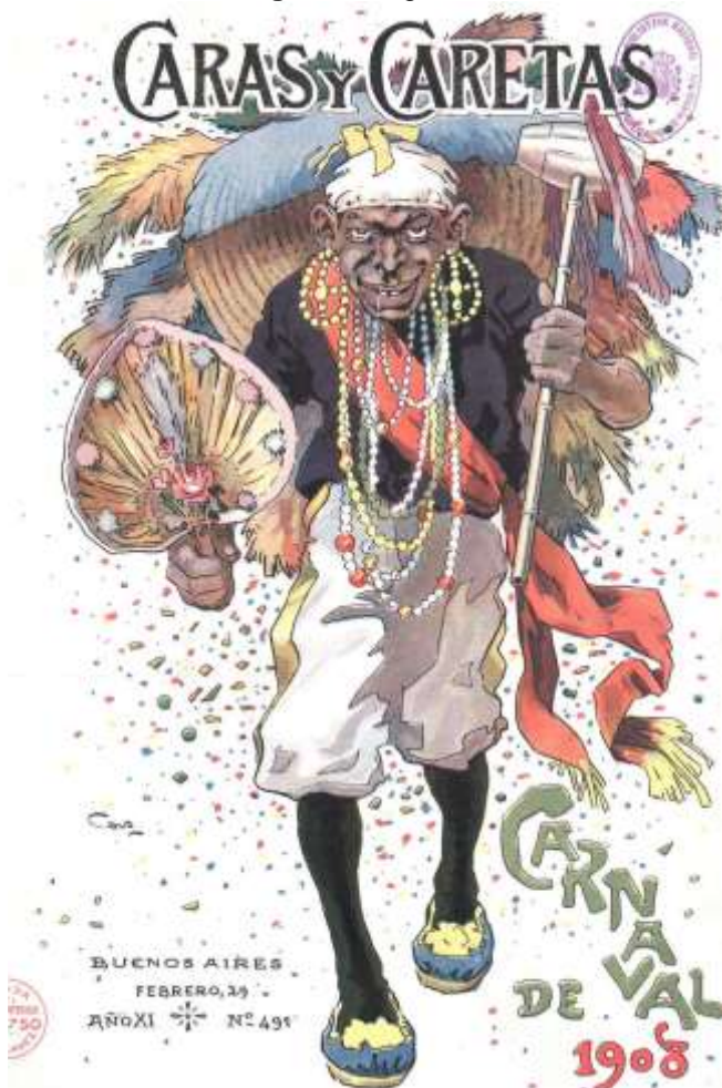
Imagen 2: Negro candombero