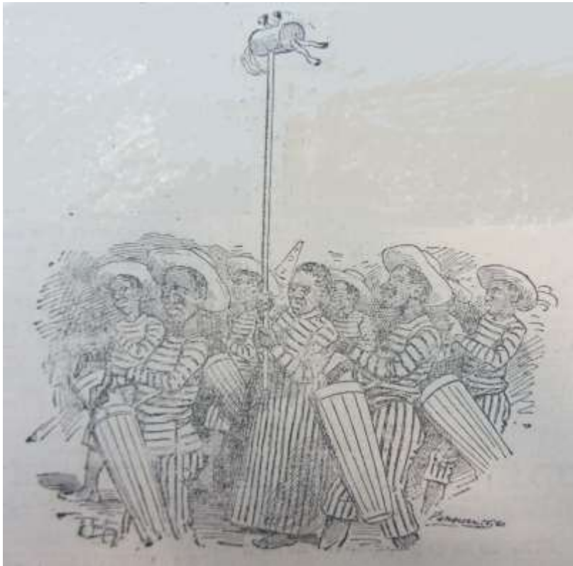
Imagen 1: Comparsa de negros candomberos

diseños, pañuelo anudado a la cabeza o sombrero de paja. Sobre esa base había variaciones. Las Negras Libres, en 1878, usaban “vestidos sandungueros” 24 . Una de las imágenes más tempranas con las que contamos (Imagen 1) muestra precisamente ese estilo, además de los infaltables masakayas y tamboriles. Otras fuentes visuales posteriores coinciden en lo esencial en las ropas y accesorios básicos 25 .