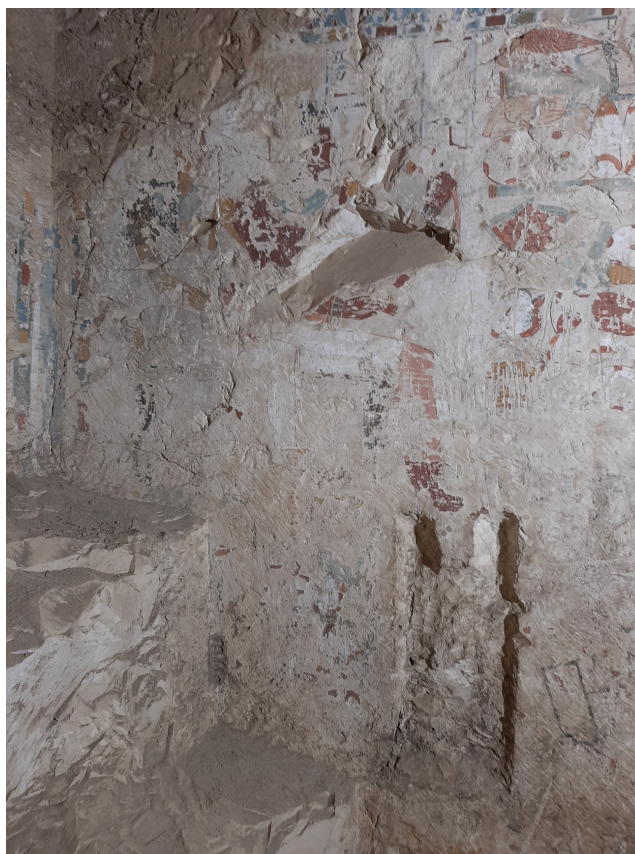
Figura 7: Intervención antrópica: hendidura en PA 9.

-concreción salina: se registran eflorescencias en algunas partes del monumento, el problema más