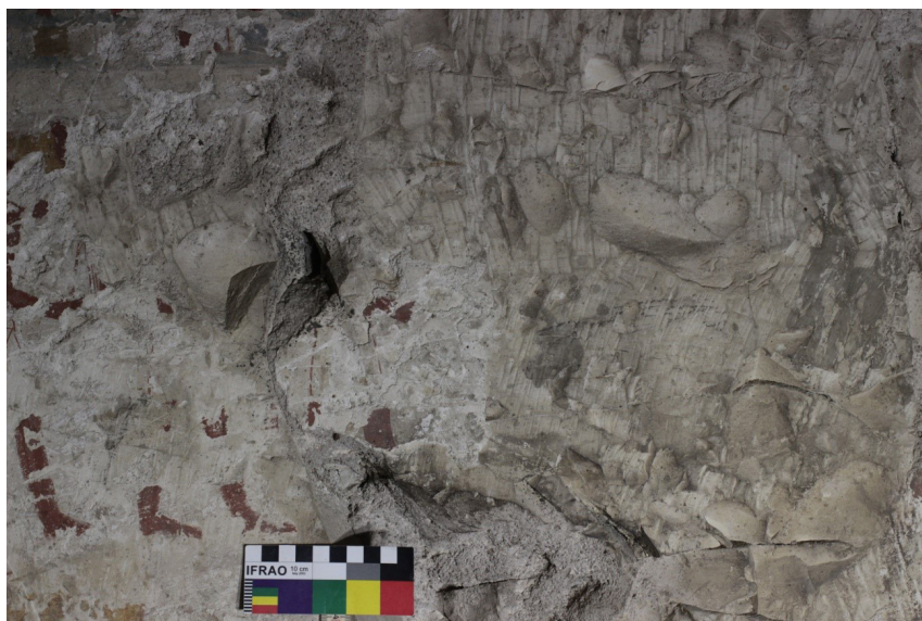
Figura 6: Marcas de cincel sobre caliza en PA 3.