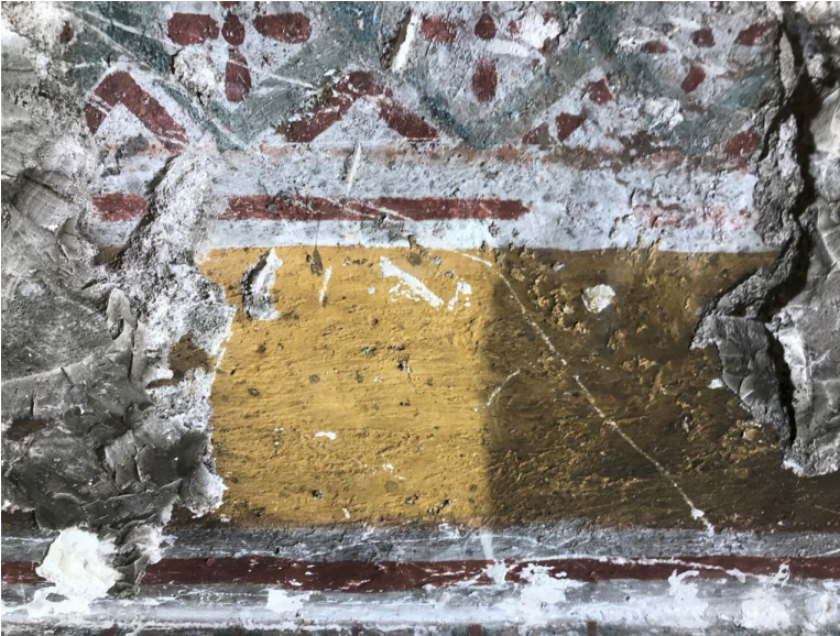
Figura 8: Limpieza con esponjas Wishab® en PA14.