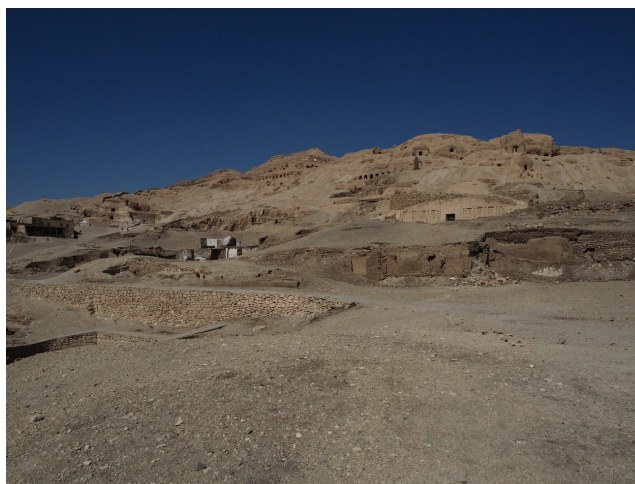
Figura 1: Vista del área.