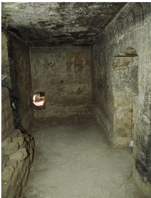
Figura 3: Foto del boquete de acceso, desde el interior de TT318.