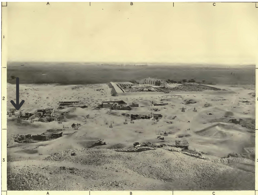
Figura 4: Área de Sheikh Abd el Qurnah. Gardiner y Weigall (1913, Lámina IV).