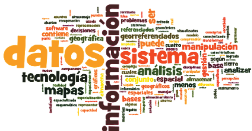
Figura 2.2. Nube de palabras surgida de 24 definiciones globales, funcionales y tecnológicas recopiladas por Navarro Pedreño et al. (2000).

Maps 68 , Yahoo! Maps 69 ) permiten almacenar y analizar visualmente información espacialmente explícita. Google Earth, en particular, constituye una herramienta con enorme potencial en el proceso de OTR al permitir a un amplio rango de usuarios acceder a una gran cantidad de información, como imágenes satelitales de alta resolución espacial (y cierta temporalidad), cartografía base (rutas, áreas urbanas, etc.), cartografía temática (disponible en la comunidad Google Earth o en las mismas capas del software), modelos de elevación digital, fotografías del terreno, etc. Debe destacarse que la exploración de los metadatos de este sistema es restringida o críptica al –por ejemplo– no poder conocer la procedencia de la información topográfica. Asimismo, la descarga de la información contenida en este sistema no es posible debido a obvias restricciones legales; no obstante, existen algunos programas para descargar la información que se visualiza en formato de jpg o similares ( e.g. Google Ozi Explorer 70 ). Finalmente, Google Earth permite a los actores involucrados en el proceso de OTR combinar en su interfase tridimensional, mapas propios generados con otras tecnologías (y distribuirlos fácilmente en formato kml), logrando así la convergencia de información en un sistema de uso gratuito y que no requiere conocimientos especializados.