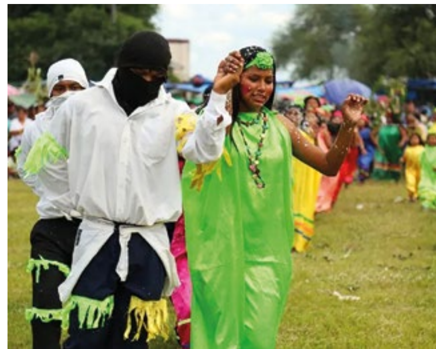
ARETE GUASU EN LA ACTUALIDAD, TARIJA, BOLIVIA..