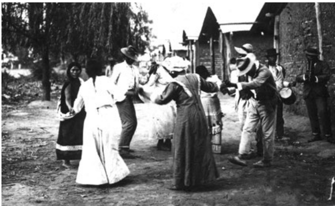
PIN PIN EN EL INGENIO, RITUAL DEL ARETE GUASU.

Ni cientos de conquistas, de guerras y de genocidios pudieron borrar la historia y la cultura de estas poblaciones. Mientras estas sobrevivan, la comunidad habrá ganado. Y el yagareté se alzará al fin victorioso sobre el toro.