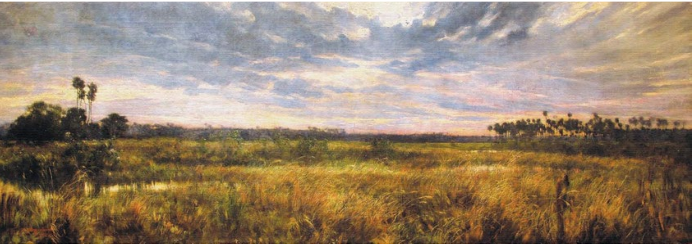
PINTURA DE GUIDO BOGGIANI.