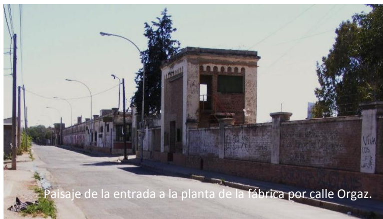
Paisaje de la entrada a la planta de la fábrica por calle Orgaz.

Prieto: Y bueno, [la fábrica] llegó a tener... me contaba mi papá que llegó a tener 500 empleados. En tiempos de antes, cuando hacían todo a mano. Ponían la etiqueta a mano, otros le ponían las tapas a la Dorada, ¿viste el papel? ¡Todo a mano! Y en la temporada [de verano] llegó