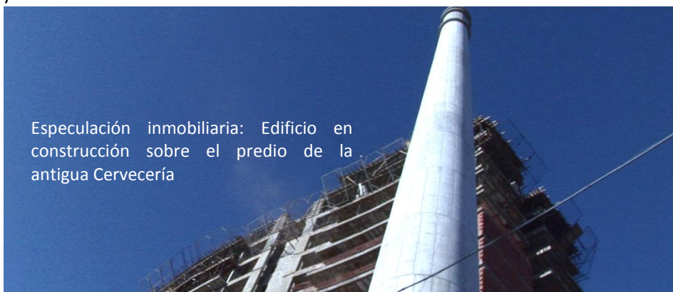
Especulación inmobiliaria: Edificio en construcción sobre el predio de la antigua Cervecería

Iniciamos este trabajo, 15 años después de aquel fatídico desalojo de la fábrica del barrio, cuando nos encontramos con algunos de ellos que todavía hoy a las 6 de la mañana ojean esperando aquel sonido. Los “ruidos” de la nostalgia que hoy cargan, pos años noventa, es un poco lo que motivó este trabajo. En un comienzo la idea había sido ampliar el documental “Huevo, Huevo, Cervecerero” que, elaborado por sus propios protagonistas, relataba el momento de una de las tomas más grandes del movimiento obrero de la República Argentina: La toma de la Cervecería Córdoba durante 105 días en aquel 1998. Nos sorprendieron la intensidad y la fuerza con que algunos vecinos y vecinas de Alberdi, de diversas franjas etarias (abuelos/as, jóvenes, niños/as), recordaban tanto la lucha por la fuente de trabajo como la importancia que tenía la fábrica (para el barrio y la ciudad de Córdoba): la fuente económica, abastecedora de comercios secundarios vinculados (almacenes, camiones, boliches), eventos sociales como las peñas y los bailes, el bingo, lugares de encuentro como los clubes; y todo un mundo vinculado a ella.