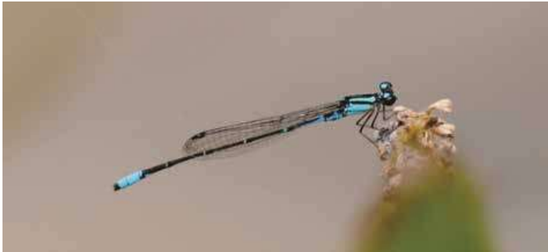
Figura 9. Macho de Acanthagrion lancea (Coenagrionidae).