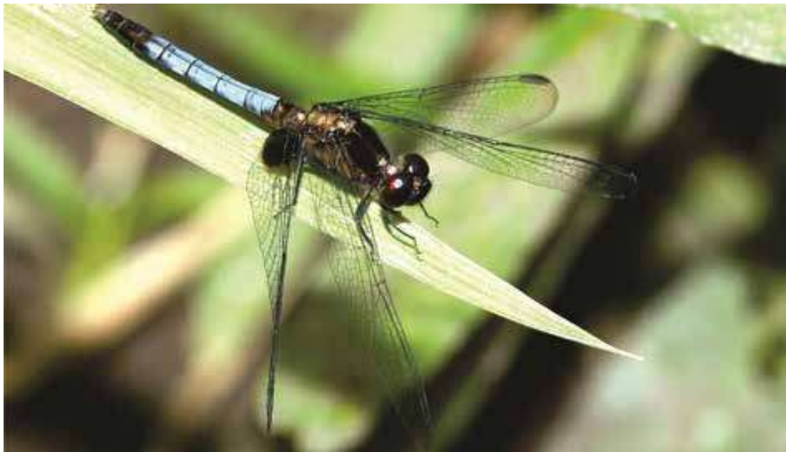
Figura 16. Macho de Erythrodiplax media (Libellulidae).