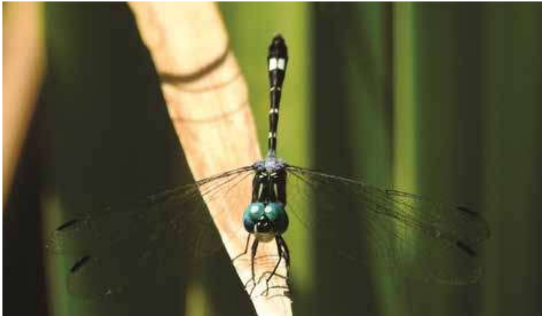
Figura 15. Macho de Micrathyria hypodidyma (Libellulidae).