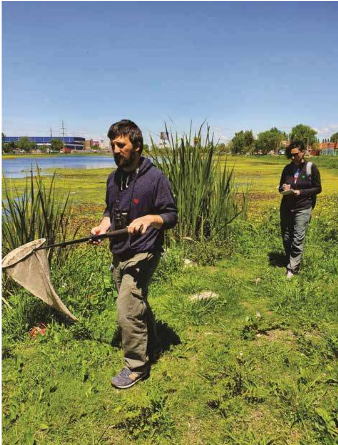
Figura 5. Laguna Saladita Norte, Avellaneda. Muestreo cuantitativo de adultos de odonatos.