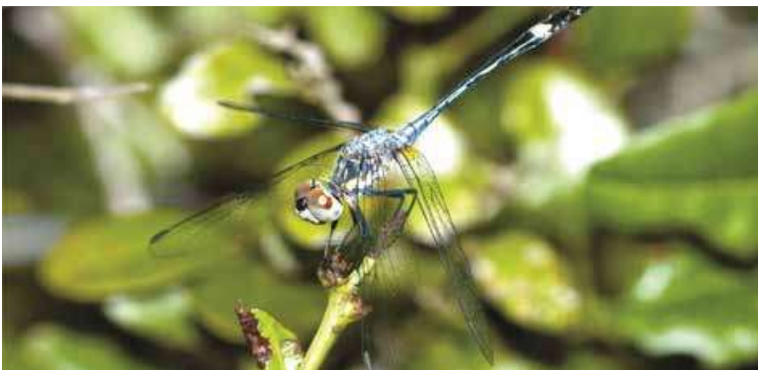
Figura 14. Macho de Micrathyria longifasciata (Libellulidae).