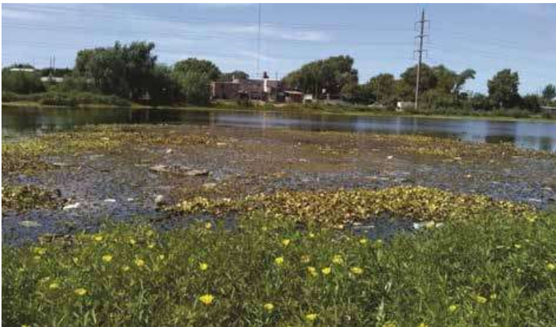
Figura 3. Laguna Saladita Norte, Avellaneda. Vista Sur.