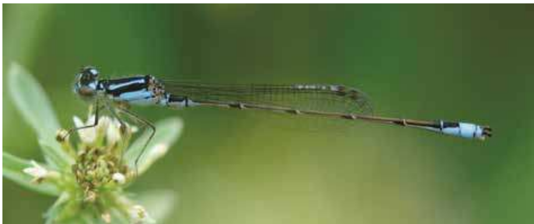
Figura 11. Macho de Homeoura chelifera (Coenagrionidae)