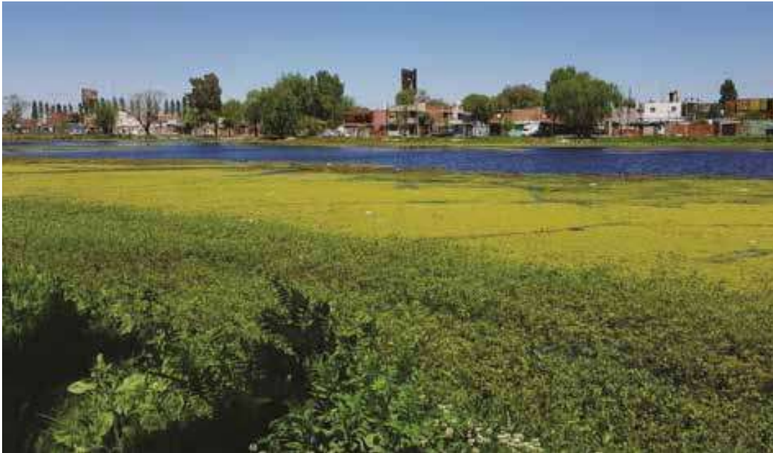
Figura 2. Laguna Saladita Norte, Avellaneda. Vista Norte.

En la actualidad, en Avellaneda persisten sobre su planicie de inundación áreas de notable valor biológico que corresponden al albardón costero ubicado al sur del canal Santo Domingo y a lagunas de origen antrópico como la Saladita Sur y la Saladita Norte (Figura 1).