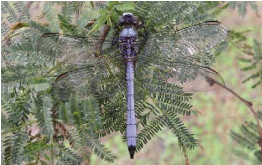
Figura 18. Macho de Erythrodiplax pallida (Libellulidae).