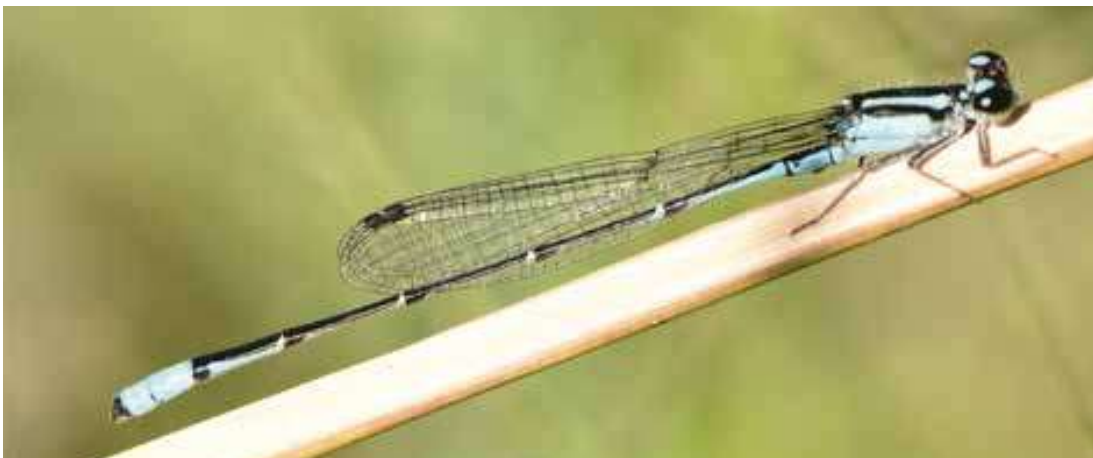
Figura 17. Macho de Acanthagrion cuyabae (Coenagrionidae).

Finalmente, merece destacarse la presencia en Saladita Norte de Acanthagrion cuyabae , Erythrodiplax pallida y E. paraguayensis , lo que constituye, además de nuevos registros para Avellaneda, los registros más australes de cada una de estas especies (Figuras 17-19).