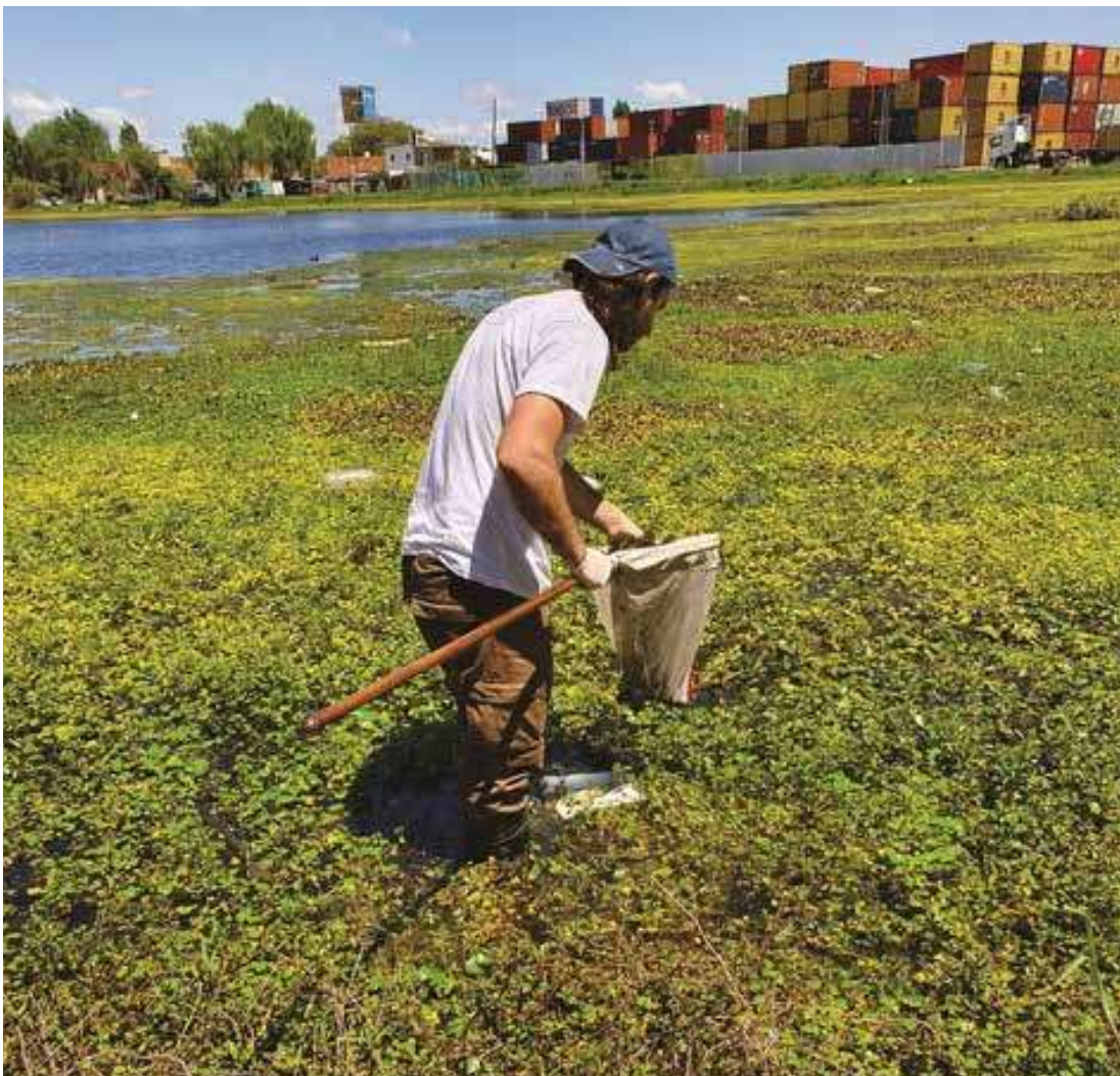
Figura 7. Laguna Saladita Norte, Avellaneda. Muestreo complementario de insectos acuáticos.