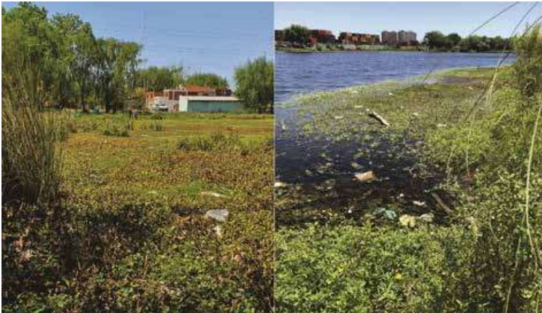
Figura 6. Laguna Saladita Norte, Avellaneda. Vegetación ribereña y carpeta flotante.