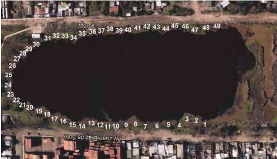
Figura 4. Laguna Saladita Norte, Avellaneda. Subdivisión de la línea de costa accesible en secciones de 10 metros.

posterior identificación a nivel específico en laboratorio. Los ejemplares recolectados se fijaron mediante una inyección con alcohol 96% y luego fueron deshidratados con sílica gel; una vez secos se guardaron en sobres plásticos. Se seleccionaron ejemplares voucher preservados en alcohol etílico absoluto para futuros estudios moleculares. Todos los ejemplares fueron depositados en la colección del Laboratorio de Biodiversidad y Genética Ambiental (BioGeA) de la Universidad Nacional de Avellaneda.