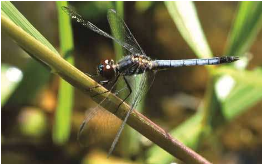
Figura 19. Macho de Erythrodiplax paraguayensis (Libellulidae)

Acanthagrion cuyabae y E. paraguayensis son especies típicas de humedales de tipo léntico, tanto permanentes como temporarios, de presencia regular o abundante en las provincias de Corrientes, Chaco, Santa Fe y Entre Ríos. Erythrodiplax