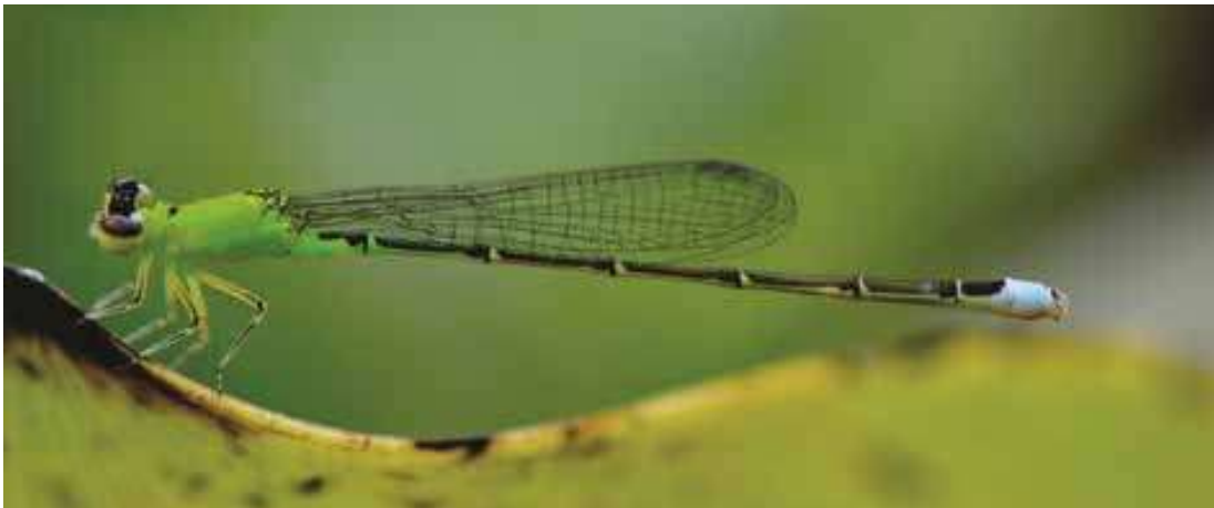
Figura 13. Hembra de Ischnura capreola (Coenagrionidae).