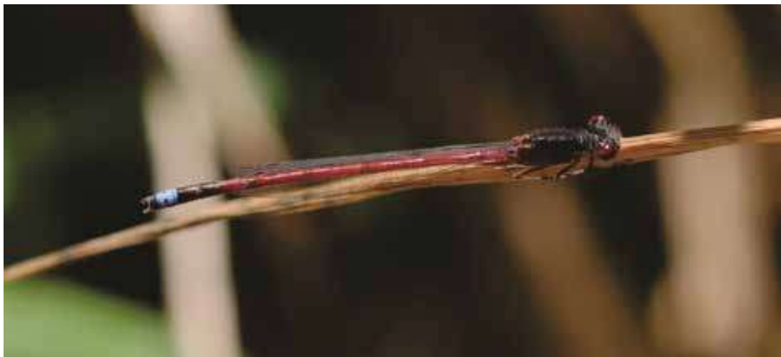
Figura 10. Macho de Oxyagrion terminale (Coenagrionidae)