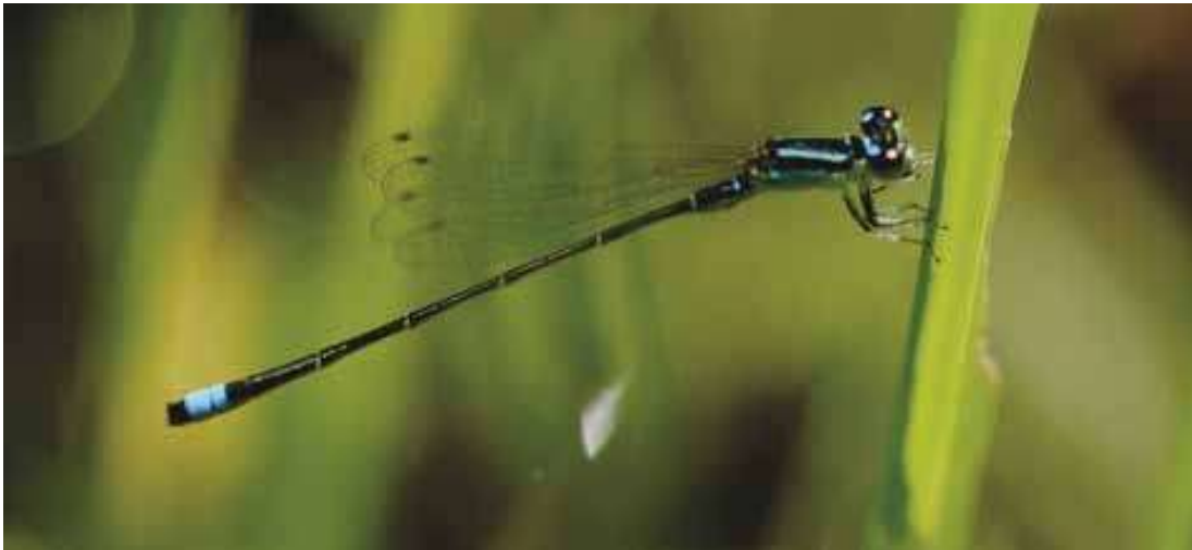
Figura 12. Macho de Ischnura capreola (Coenagrionidae).