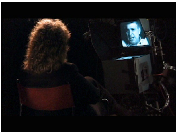
Figura 7. «Smiling in a Jar», capítulo de First Person . (Morris, 2000)