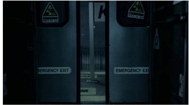
Figura 6. Nadie sube al tren en The Jinx: The Life and Deaths of Robert Durst . © Hit The Ground Running Films (Jarecki 2015)

las recreaciones no solo remarcan aspectos relevantes para la investigación policial, sino que también ilustra los diversos escenarios posibles del caso.