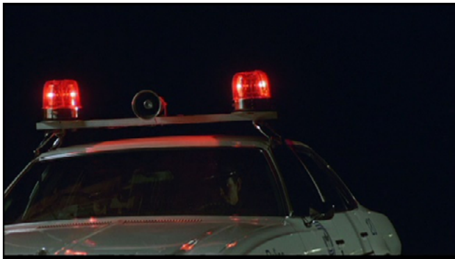
Figura 3. Una de las primeras tomas de The Thin Blue Line . ©American Playhouse (Morris, 1988).