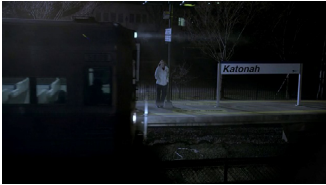
Figura 5. Recreación de Kathie Durst esperando el tren en The Jinx: The Life and Deaths of Robert Durst . © Hit The Ground Running Films (Jarecki, 2015).