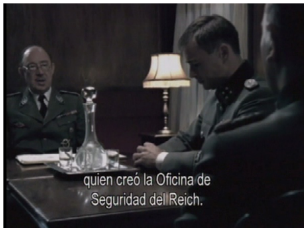
Figura 1. Recreación de una reunión de Heinrich Himmler en Auschwitz: The Nazis and 'The Final Solution' (Rees, 2005).

No es la primera ni la última vez que Rees produce un documental sobre el nazismo o el Holocausto, su dedicación a la temática se inició con un documental sobre el ministro de propaganda nazi, Joseph Goebbels, al comienzo de la década del noventa 7 y culminó —al menos provisoriamente— con Touched by Auschwitz (2015). En ese lapso, y previo a la miniserie que quiero comentar, escribió y produjo The Nazis. A warning from history (1997). Entre todos los títulos mencionados, su obra alternó series documentales sobre temas históricos en general como sobre la Segunda Guerra Mundial en particular.