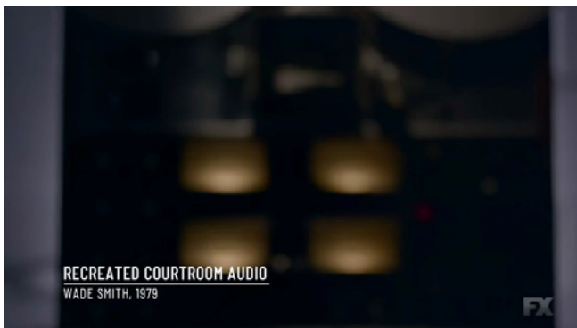
Figura 10. Audio recreado en A Wilderness of Error . © Blumhouse Television (Smerling, 2020).

A priori se puede pensar que las marcadas puestas en escenas o el uso recurrente de las recreaciones acercaría más a una producción hacia la ficción que a la no ficción. Sin embargo, este recurso se encuentra cada vez más presente en el documental contemporáneo. Por un lado, el documental más próximo al performativo ha llevado a correr las fronteras de la no ficción, habilitando que la manera de tratar creativamente la realidad sea utilizada también en obras que no apelan a explorar la subjetividad del realizador. Por el otro lado, las recreaciones no son invenciones nuevas en el documental, sino que se encuentran presentes desde su propio origen. Así, mientras que en el período clásico estas intentaban ser ocultadas, haciéndolas pasar como «registro real», en la actualidad ese registro hace evidente su puesta en escena. En otras palabras, mientras que en el período clásico se ocultaban «las costuras» de la puesta en escena, en la actualidad están a la vista. En esa dirección, las tres miniseries que aquí expuse intentan dar cuenta también de cómo el archivo deja de ser un inconveniente para organizar el relato documental. Esta liberación del archivo, esta no dependencia hacia el registro factual previo, permite también buscar otras formas de exponer y argumentar los temas e ideas en forma audiovisual; en consecuencia, la evidencia documental se construye en la actualidad de otro modo. Este problema, desde ya, no