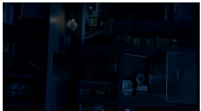
Figura 11. Toma cenital de la recreación de la posible escena del crimen en A Wilderness of Error . © Blumhouse Television (Smerling, 2020).