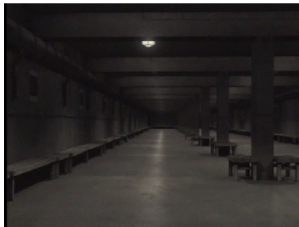
Figura 2. Recinto para sacarse la ropa en las cámaras de gas recreado con CGI en Auschwitz: The Nazis and 'The Final Solution' ©BBC (Rees, 2005).

no es su carácter minucioso e histórico lo que llama la atención, sino la manera en que nos presenta la historia. Así, las estrategias de representación empleadas funcionan en cinco niveles: 1) registro en el lugar de los hechos, es decir, el registro del campo en la actualidad; 2) entrevistas a testigos cuyos relatos actúan como evidencia 8 , como a los sobrevivientes Eva Mozes Kor, Dario Gabbai o Jozef Paczynski, o el ex s Oskar Gröning, por citar a algunos; 3) imágenes de archivo que son repuestas en su contexto, es decir, son utilizadas como evidencia e ilustración de lo que se relata, respetando y reponiendo el contexto de producción y registro 9 ; 4) una voz en off próxima la voz de Dios que relata la historia.