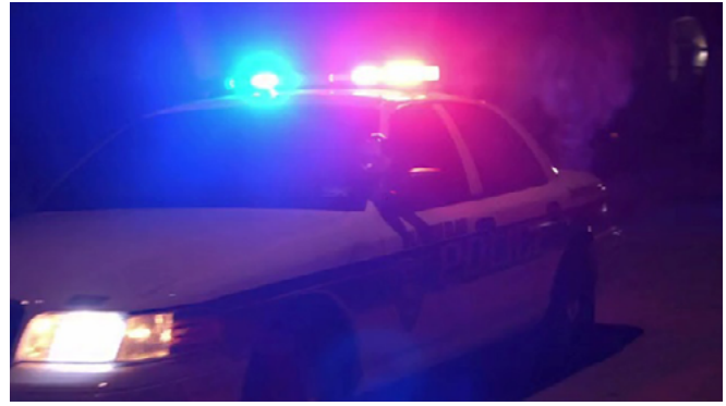
Figura 4. Una de las primeras tomas de The Jinx: The Life and Deaths of Robert Durst . ©Hit The Ground Running Films (Jarecki, 2015).

o resueltas. Estos niveles, entonces, resultan ser las estrategias tradicionales del documental, e incluso de los documentales sobre el tema.