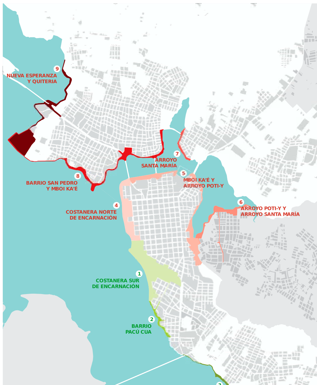
Mapa 1 Nuevo frente fluvial de la Ciudad de Encarnación, Paraguay, 2016