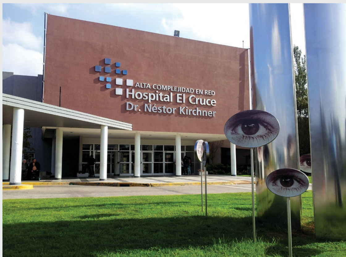
Hospital El Cruce Dr. Néstor Kirchner